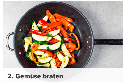
2. Gemüse braten

Tipp: Für weniger Schärfe die Kerne entfernen.