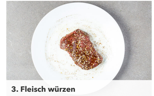
3. Fleisch würzen

Das Gemüse und die Peperoni in einer großen Pfanne mit 2EL Olivenöl und je 1 kräftigen Prise Salz und Pfeffer bei mittlerer bis starker Hitze 6–8Min. goldbraun braten.