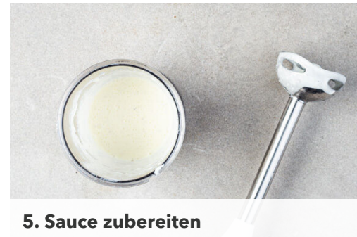
5. Sauce zubereiten

Das Fleisch in einer großen Pfanne bei starker Hitze auf der Fettseite 2–4Min. scharf anbraten. Wenden und weitere 2–4Min. braten, je nach Dicke des Fleisches. Die Hitze reduzieren und das Fleisch 1–3Min. abgedeckt garen, je nachdem, ob es medium oder durch sein soll. Nach Geschmack mit Salz und Pfeffer würzen, abgedeckt 3–4Min. auf einem Teller ruhen lassen und in Tranchen schneiden.