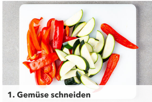
1. Gemüse schneiden

Energie 452kcal, Fett 30.1g, Kohlenhydrate 12.3g, Eiweiß 34.2g