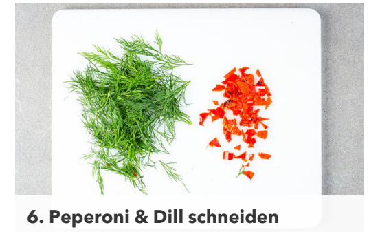
6. Peperoni & Dill schneiden

Den Knoblauch schälen und mit dem Joghurt , 2EL Olivenöl, 2EL Essig oder mehr nach Geschmack in einem hohen Gefäß mit einem Stabmixer zu einer glatten Sauce pürieren und mit Salz und Pfeffer abschmecken.