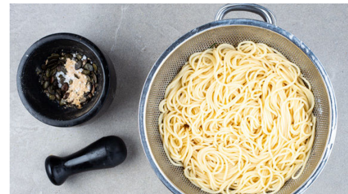
5. Kürbiskerne mörsern

Die Mandeln grob hacken und in einer kleinen Pfanne ohne Zugabe von Fett bei mittlerer Hitze 1-2Min. goldbraun anrösten. Vorsicht , sie können schnell zu dunkel werden. Zum Abkühlen aus der Pfanne nehmen, die Pfanne aufbewahren. In einem mittelgroßen Topf ausreichend gesalzenes Wasser für die Pasta zum Kochen bringen. Den Knoblauch schälen und halbieren.