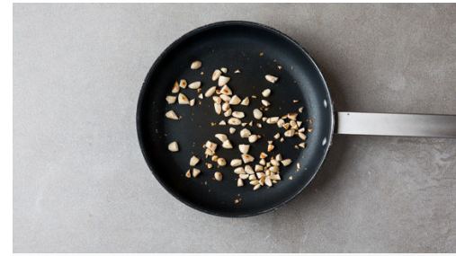
2. Mandeln anrösten

Die \frac{1}{2} der Oliven halbieren oder grob schneiden und für die letzten ca. 5Min. der Garzeit mit 2EL Zitronensaft unter die Auberginen mengen. Tipp: Wer mag, kann auch mehr Oliven verwenden.