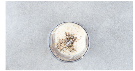
3. Mandelcreme zubereiten

Die Pasta in das kochende Wasser geben und in 13-14Min. bissfest kochen. Ca. 1 Tasse Pastawasser abschöpfen, dann die Pasta in ein Sieb abgießen und abtropfen lassen. Die Kürbiskerne in der kleinen Pfanne ohne Zugabe von Fett bei mittlerer Hitze 2-4Min. anrösten. Aus der Pfanne nehmen und mit den restlichen Hefeflocken sowie 1 Prise Salz in einem Mörser fein zerstoßen.