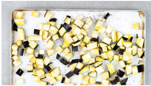
1. Aubergine backen

Energie 985kcal, Fett 53.4g, Kohlenhydrate 93.5g, Eiweiß 31.4g