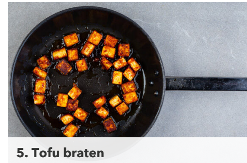
5. Tofu braten

Die Karotte ggf. schälen und grob reiben. In einer kleinen Pfanne 1EL Pflanzenöl bei mittlerer Hitze erwärmen. Die Karottenraspel , die ½ der Sojasauce , 2TL hellen Essig und ½TL Zucker in die Pfanne geben und 3-4Min. braten, bis die Karotten weich werden.