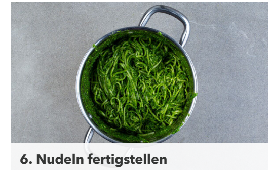
6. Nudeln fertigstellen

In einer mittelgroßen Pfanne 2EL Pflanzenöl bei mittlerer Hitze erwärmen. Den Tofu in das heiße Öl geben und 4-6Min. rundum knusprig-braun anbraten. Die Pfanne vom Herd nehmen und den Tofu mit 1 Prise Salz würzen. Nebenher die ½ der Nudeln in das kochende Wasser geben und in ca. 4Min. bissfest kochen.