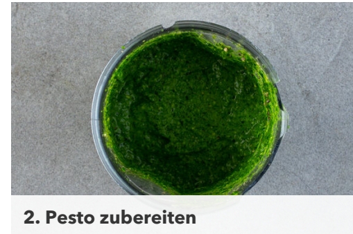
2. Pesto zubereiten

Den Spinat grob hacken. Den Knoblauch schälen. Ca. ¼ der Korianderblätter abzupfen und für die Garnitur beiseitelegen.