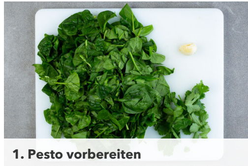
1. Pesto vorbereiten

Energie 1168kcal, Fett 45.4g, Kohlenhydrate 140.9g, Eiweiß 40.4g