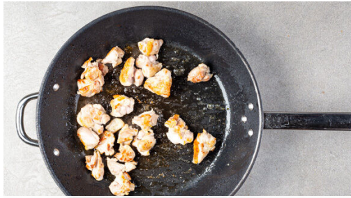
1. Fleisch anbraten

Energie 1006kcal, Fett 64.4g, Kohlenhydrate 68.2g, Eiweiß 37.7g