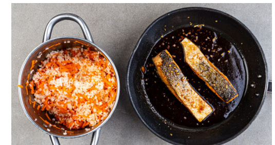
6. Lachs glasieren

Den Spinat in den anderen Topf mit kochendem Wasser geben, umrühren und 30-45Sek. blanchieren, dann in ein Sieb abgießen und gründlich mit kaltem Wasser abspülen. Mit den Händen so viel Flüssigkeit wie möglich herausdrücken, den Spinat anschließend grob schneiden. Den Knoblauch schälen und fein würfeln.