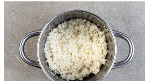
2. Reis kochen

Den Sesam mit dem Sesamöl , der ½ des Knoblauchs , der ½ der Sojasauce , 1TL Zucker und 1TL Essig verrühren. Den Spinat mit dem Sesamdressing vermengen.