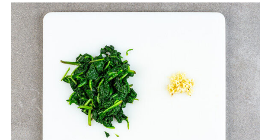
3. Spinat blanchieren

Den Fisch mit kaltem Wasser abspülen, trocken tupfen und evtl. vorhandene Gräten und Schuppen entfernen. Mit Salz und Pfeffer würzen und in einer mittelgroßen Pfanne mit 1EL Pflanzenöl bei mittlerer Hitze 5–7Min. auf der Hautseite braten, bis die Haut knusprig ist. Inzwischen die restliche Sojasauce , den restlichen Knoblauch , 1EL Honig und ½TL Essig zu einer Würzsauc e verrühren.