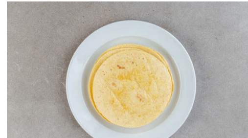
5. Tortillas erwärmen

Die Zwiebel schälen, halbieren und in feine Streifen schneiden.