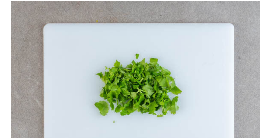
6. Koriander schneiden

Die ½ der Ananas in einem Sieb abtropfen lassen und grob hacken . Die Ananas und die ½ der Zwiebeln unter die Gurken mengen.