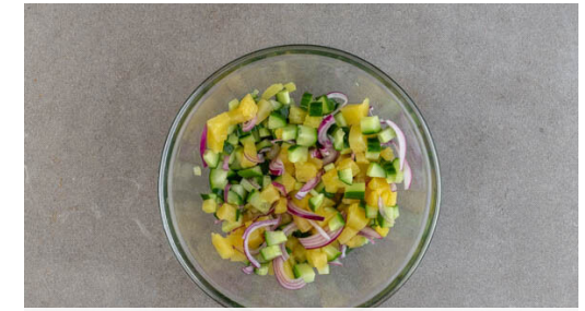
3. Salsa zubereiten

Jeweils 4 Tortillas aufeinanderstapeln und bei 800W 35–40Sek. in der Mikrowelle erwärmen. Den Vorgang mit den übrigen Tortillas wiederholen.