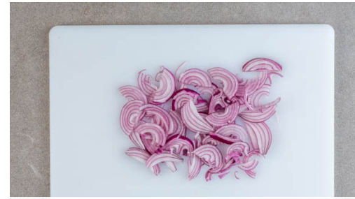
2. Zwiebel schneiden

Die Garnelen in einem Sieb kalt abspülen und abtropfen lassen, dann trocken tupfen. Die restlichen Zwiebeln in einer mittelgroßen Pfanne mit 1EL Olivenöl bei mittlerer Hitze ca. 1Min. anbraten. Die Garnelen hinzugeben und 1-2Min. braten, bis sie gar sind. Die Gewürzmischung unterrühren und 1Min. mitbraten. Ggf. mit Salz und Pfeffer abschmecken.