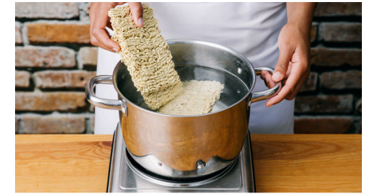
3. Nudeln vorkochen

Den Essigmix mit der Sojasauce und 2TL Honig oder mehr Zucker verrühren. Für ein kaltes Gericht die Pfanne vom Herd nehmen und die Nudeln und die Würzsauce unterrühren, dann abkühlen lassen. Für ein warmes Gericht die Nudeln und die Würzsauce zugeben und alles weitere 1-2Min. bei mittlerer Hitze braten.