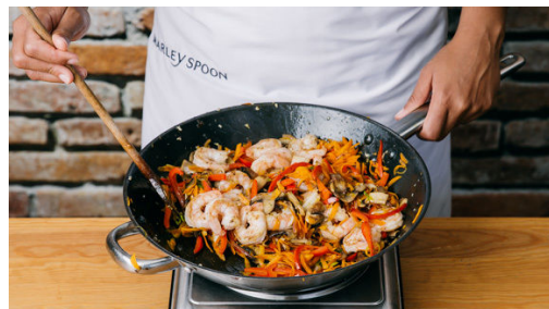
4. Gemüse braten

In einem großen Topf ausreichend gesalzenes Wasser für die Nudeln zum Kochen bringen. Die Paprika vierteln, entkernen und in dünne Streifen schneiden. Die Pilze ggf. säubern und in dünne Scheiben schneiden. Die Zwiebeln schälen, halbieren und in feine Streifen schneiden. Den Knoblauch schälen und fein würfeln.