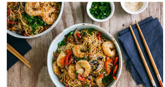
6. Anrichten und servieren

Die Nudeln in das kochende Wasser geben und in 3-5Min. bissfest kochen. Währenddessen die Garnelen kalt abspülen und mit etwas Küchenkrepp trocken tupfen. Die Nudeln in ein Sieb abgießen und mit kaltem Wasser abspülen.