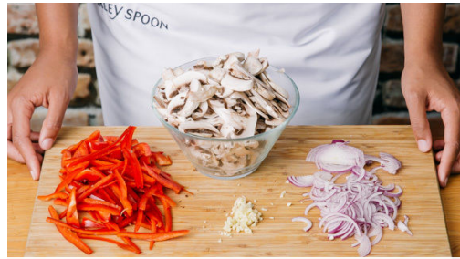
1. Gemüse schneiden

Vergiss nicht, das Gemüse vor der Zubereitung gründlich zu waschen, insbesondere grünes Blattgemüse und Salate.