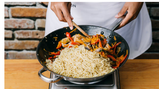
5. Nudelpfanne fertigstellen

Die Karotten ggf. schälen und grob reiben. Die Lauchzwiebeln in feine Ringe schneiden, dabei den weißen vom grünen Teil trennen.