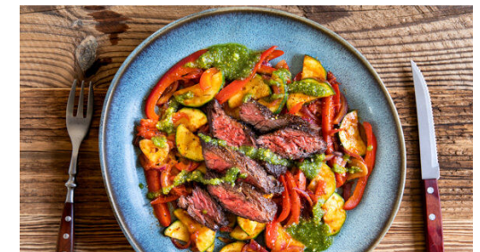
6. Anrichten und servieren

Die Zwiebeln , die Zucchini und die Paprika in einer zweiten Pfanne mit 2EL Olivenöl bei starker Hitze 3-4Min. anbraten. Dann den restlichen Knoblauch , die Tomaten und 2EL Ketchup hinzufügen. Ca. 3Min. braten, bis das Gemüse gar, aber noch bissfest ist. Mit der Gewürzmischung , \frac{1}{2} TL Salz und 1 kräftigen Prise Pfeffer abschmecken.