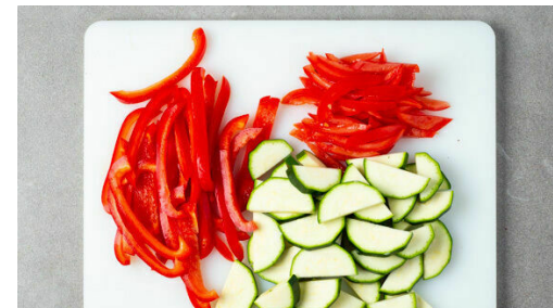
2. Gemüse schneiden

Die Zwiebeln schälen, halbieren und in feine Streifen schneiden. Den Knoblauch schälen und in feine Scheibchen schneiden.