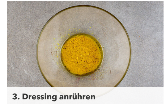
3. Dressing anrühren

Den Lauch vom Herd nehmen und mit 1 kräftigen Prise Pfeffer würzen. Die Crème fraîche und den Käse unterrühren und den Käse-Lauch-Mix gleichmäßig auf 4 Pitas verteilen. Den Brokkoli und den Speck darauf anrichten.