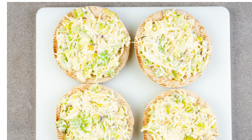
5. Pitas belegen

Den Lauch längs halbieren, in feine Streifen schneiden und in einer mittelgroßen Pfanne mit 1EL Olivenöl und 1 Prise Salz bei mittlerer Hitze in 6-9Min. sehr weich braten.