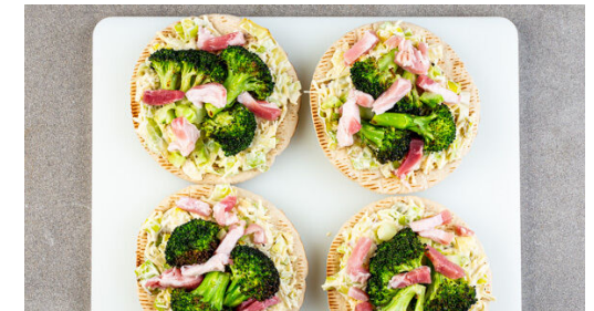
6. Pitapizzen backen

4TL Olivenöl, 2TL hellen Essig, 1TL Senf und 1TL Honig zu einem Dressing verrühren und mit Salz und Pfeffer nach Geschmack würzen.