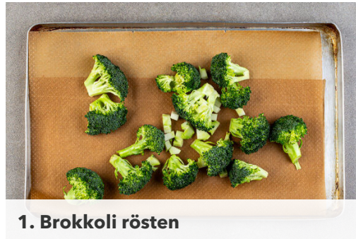
1. Brokkoli rösten

Energie 1190kcal, Fett 68.3g, Kohlenhydrate 94.1g, Eiweiß 44.9g