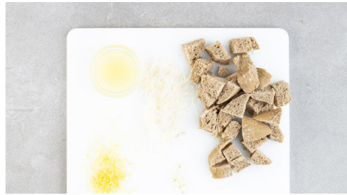
1. Croûtons vorbereiten

Energie 682kcal, Fett 37.4g, Kohlenhydrate 44.7g, Eiweiß 39.9g