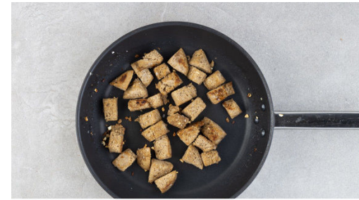
2. Croûtons rösten

Das Brötchen zuerst in Scheiben und anschließend in 1-2cm große Würfel schneiden. Den Knoblauch schälen und fein würfeln. Den Käse fein reiben. Die Zitronenschale abreiben, dann die Zitrone halbieren und auspressen.