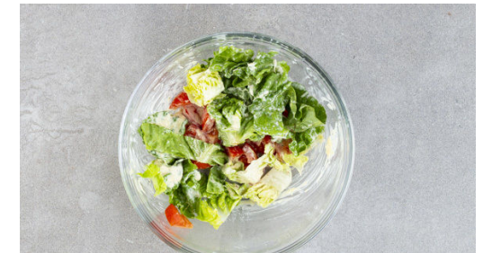
6. Salat fertigstellen

Das Fleisch trocken tupfen, in 1-2cm dicke Streifen schneiden, mit je 1 Prise Salz und Pfeffer würzen und in der Pfanne mit 1EL Olivenöl bei mittlerer bis starker Hitze in 3-4Min. goldbraun und gar braten.