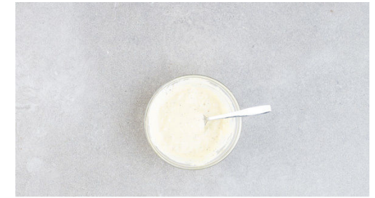
3. Dressing anrühren

Ca. die ½ des Knoblauchs mit 1EL Olivenöl in einer mittelgroßen Pfanne bei mittlerer Hitze erwärmen und die Brotwürfel darin in 3-5Min. goldbraun anrösten. Die Croûtons mit 1 Prise Salz würzen, aus der Pfanne nehmen und beiseitestellen. Die Pfanne aufbewahren.