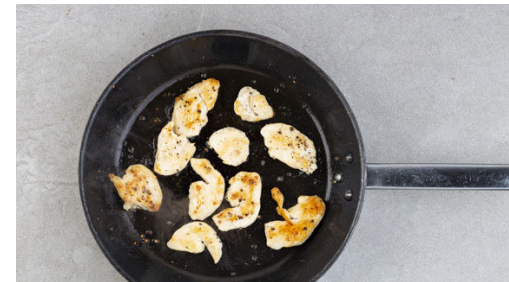
5. Fleisch braten

Die Tomaten würfeln. Den Romanasalat in mundgerechte Streifen schneiden, dabei den Strunk entfernen.