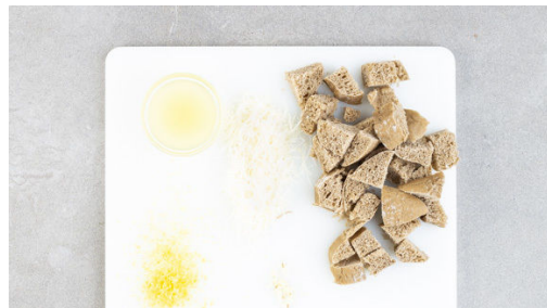
1. Croûtons vorbereiten

Energie 638kcal, Fett 33.6g, Kohlenhydrate 42.1g, Eiweiß 39.5g