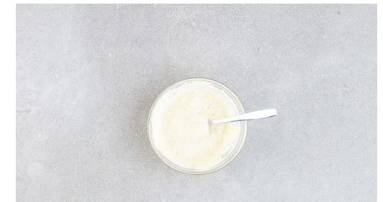
3. Dressing anrühren

Ca. die ½ des Knoblauchs mit 2EL Olivenöl in einer großen Pfanne bei mittlerer Hitze erwärmen und die Brotwürfel darin in 3-5Min. goldbraun anrösten. Die Croûtons mit 1 Prise Salz würzen, aus der Pfanne nehmen und beiseitestellen. Die Pfanne aufbewahren.