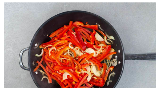
2. Gemüse braten

Das angebratene Gemüse und die Crème fraîche in einem hohen Gefäß mit einem Stabmixer zu einer glatten Sauce pürieren.