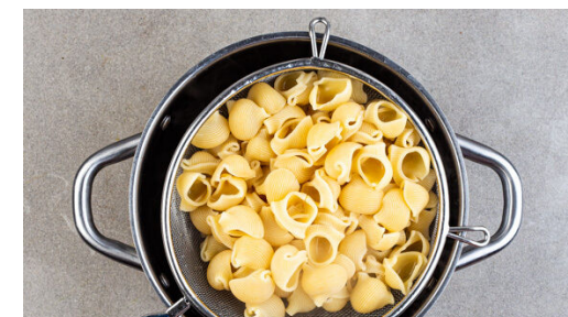
3. Pasta vorkochen

Die Pasta mit der Sauce und der ½ des Käses vermengen, nach Geschmack mit Salz und Pfeffer würzen. In eine große Auflaufform geben und den restlichen Käse darüberstreuen. Den Auflauf im Ofen ca. 10Min. backen, bis der Käse knusprig und goldbraun ist. Tipp: Nach Möglichkeit während der letzten ca. 3Min. die Grillfunktion zuschalten.