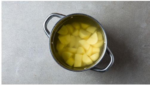
1. Kartoffeln kochen

Energie 807kcal, Fett 41.4g, Kohlenhydrate 62.1g, Eiweiß 39.5g