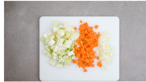
2. Gemüse schneiden

Die Zwiebeln in einer großen Pfanne mit 1EL Olivenöl bei starker Hitze ca. 2Min. goldbraun anbraten. Die Zwiebeln aus der Pfanne nehmen und beiseitestellen. Das Hackfleisch in der Pfanne 3-4Min. kross anbraten, dabei mit dem Kochlöffel zerdrücken. Mit je 1 Prise Salz und Pfeffer würzen und die Zwiebeln wieder hinzugeben.