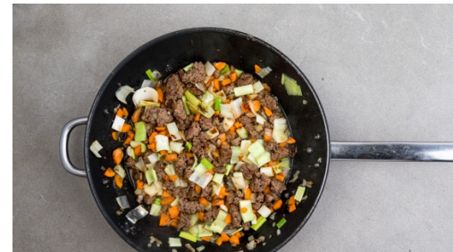
5. Gemüse mitbraten

Den Lauch längs halbieren und in ca. 1cm große Stücke schneiden. Die Karotten ggf. schälen, der Länge nach vierteln und in ca. 1cm große Würfel schneiden. Die Zwiebel schälen, halbieren und fein würfeln.