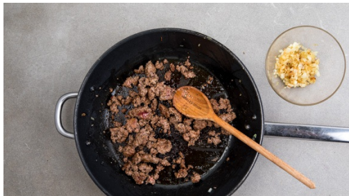
4. Fleisch anbraten

Den Backofen mit Grillfunktion oder Ober-/Unterhitze auf 250°C vorheizen. In einem mittelgroßen Topf ausreichend gesalzenes Wasser für die Kartoffeln zum Kochen bringen. Die Kartoffeln schälen und je nach Größe halbieren oder vierteln. In das kochende Wasser geben und in 10-15Min. gar kochen, dann in ein Sieb abgießen.