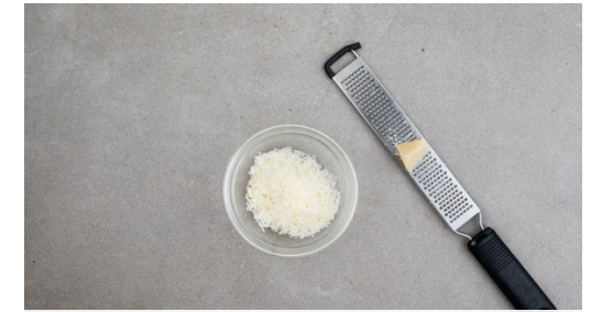
3. Käse reiben

Den Lauch und die Karotten zum Hackfleisch in die Pfanne geben und 1-2Min. mitbraten. Mit 1EL Mehl bestäuben und verrühren, dann mit 200ml Wasser ablöschen. Die ½ des Brühgewürzes hinzugeben und alles ca. 3Min. sanft einköcheln lassen. Mit Salz und Pfeffer abschmecken.