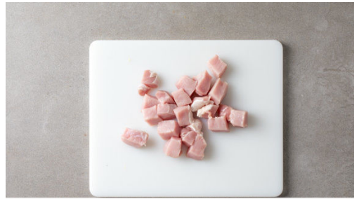
1. Fleisch schneiden

Energie 475kcal, Fett 34.4g, Kohlenhydrate 6.6g, Eiweiß 34.4g