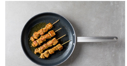
6. Souvlaki braten

Für das Dressing 2-3EL Olivenöl, 1-2TL Essig und die restliche Gewürzmischung nach Geschmack in einer großen Schüssel verrühren. Die Zwiebeln , die Gurken , die Tomaten , den Feta und die Petersilie mit dem Dressing zu einem Salat vermengen. Mit Salz und Pfeffer abschmecken.