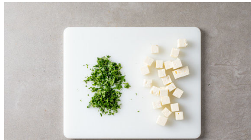
4. Feta würfeln

Die Zwiebel schälen, halbieren, in feine Streifen schneiden und leicht salzen. Die Gurke längs halbieren und quer in ca. 1cm breite Scheiben schneiden. Die Tomaten halbieren und in ca. 1cm große Würfel schneiden, dabei den Strunk entfernen.