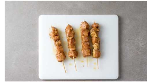
2. Fleischspieße vorbereiten

Das Fleisch mit etwas Küchenkrepp trocken tupfen und in ca. 2cm große Würfel schneiden.