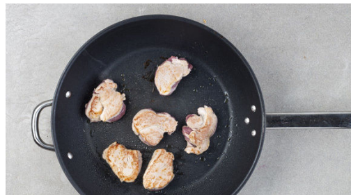
4. Fleisch anbraten

Inzwischen die Rosmarinnadeln von den Stängeln zupfen, die Thymianblätter abstreifen und beides fein hacken. Die Kräuter mit 1½TL Butter und dem Panko-Paniermehl vermengen. Mit Salz und Pfeffer abschmecken.