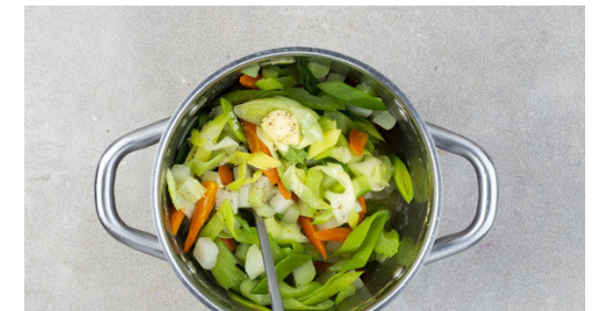
6. Gemüse abschmecken

Inzwischen die Rosmarinnadeln von den Stängeln zupfen, die Thymianblätter abstreifen und beides fein hacken. Die Kräuter mit 3TL Butter und dem Panko-Paniermehl vermengen. Mit Salz und Pfeffer abschmecken.