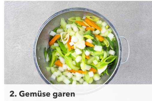
2. Gemüse garen

Das Fleisch trocken tupfen, ggf. von Sehnen befreien und in 8-10 Medaillons schneiden. Mit Salz und Pfeffer würzen und in einer großen, ofenfesten Pfanne mit 1EL Olivenöl bei starker Hitze auf jeder Seite 1-2Min. scharf anbraten.