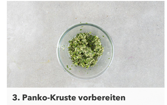
3. Panko-Kruste vorbereiten

Die Medaillons mit der Panko-Kräuter-Mischung bestreichen, dabei die Panko-Kruste etwas andrücken. Im Ofen 6-8Min. knusprig übergrillen. Tipp: Wer keine ofenfeste Pfanne hat, kann die Medaillons auch in eine Auflaufform geben.