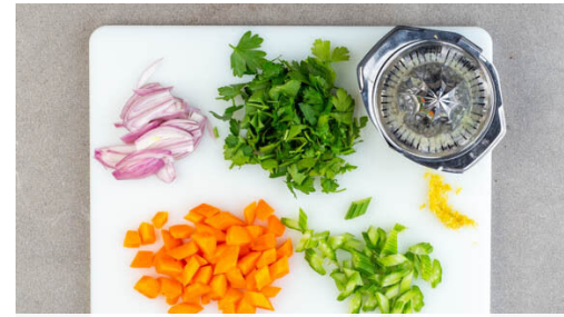
2. Zutaten vorbereiten

Verzichte auf gedruckte Rezepte - ändere die Einstellungen im Kundenkonto. Fragen zur Zubereitung oder zum Rezept? Deine Koch-Hotline: 030 208 480 510