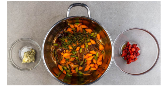
3. Eintopf ansetzen

Den Fisch kalt abspülen, trocken tupfen und evtl. vorhandene Gräten entfernen. Auf beiden Seiten mit Salz und Pfeffer würzen und auf der Hautseite in einer mittelgroßen Pfanne mit 1EL Olivenöl bei mittlerer Hitze 2-4Min. braten. Den Fisch wenden, 1EL Butter und ½EL Zitronensaft hinzugeben und 2-3Min. weiterbraten, bis er gar ist, dabei mit einem Löffel mit dem Bratfett begießen.