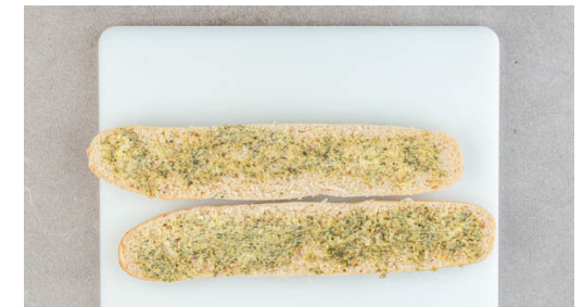
6. Baguette verfeinern

Die Chorizo in einem mittelgroßen Topf bei mittlerer Hitze in 2-4Min. leicht knusprig anbraten, ggf. 1TL Öl zugeben. Aus dem Topf nehmen und abgedeckt beiseitestellen. Die Karotten , den Sellerie , die Schalotten und den Thymian in dem Topf mit 1EL Olivenöl 3-5Min. braten, bis die Schalotten glasig sind. Die bereitgestellte Butter mit der Gewürzmischung verrühren.