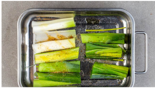
1. Lauch backen

Energie 1046kcal, Fett 61.5g, Kohlenhydrate 69.8g, Eiweiß 46.5g