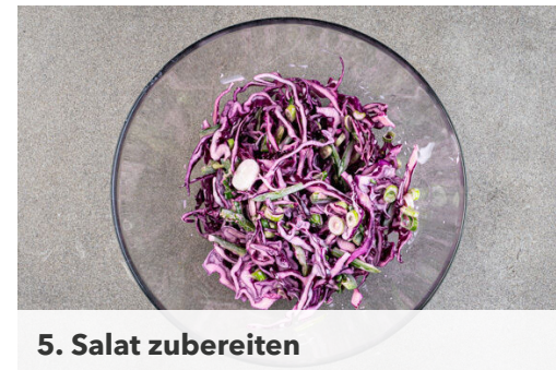
5. Salat zubereiten

1L Wasser in einem mittelgroßen Topf zum Kochen bringen. Die Äpfel schälen und in 1-2cm große Würfel schneiden, dabei das Kerngehäuse entfernen. Die Zwiebeln schälen, halbieren und in dünne Streifen schneiden.