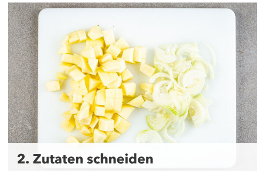
2. Zutaten schneiden

Inzwischen die Äpfel und die Zwiebeln in einer großen Pfanne mit 2EL Olivenöl bei mittlerer Hitze ca. 7Min. anbraten, dabei gelegentlich umrühren. 125-150ml Kochwasser angießen, dann 4TL Essig und 2TL Zucker einrühren und die Äpfel abgedeckt 5-6Min. köcheln lassen, bis das Wasser verdampft ist. Das Fleisch unter die Apfelsauce mengen und mit Salz und Pfeffer abschmecken.