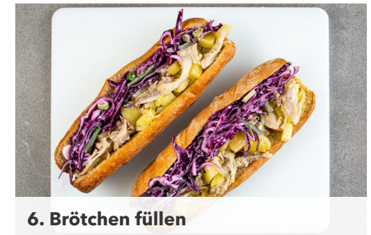
6. Brötchen füllen

Das Fleisch trocken tupfen, mit 1TL Salz in das kochende Wasser geben und abgedeckt bei mittlerer Hitze in 8-10Min. gar köcheln. Das Fleisch aus dem Topf nehmen, abkühlen lassen und mit 2 Gabeln in kleine Stücke zupfen. Das Kochwasser aufbewahren.