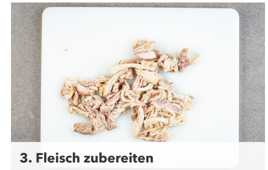
3. Fleisch zubereiten

Die Lauchzwiebeln in feine Ringe schneiden. Die Chilischote halbieren und die Kerne entfernen. Eine Hälfte oder mehr nach Belieben in hauchdünne Streifen schneiden. 2EL Mayonnaise, 2TL Senf, 2EL Essig, ½TL Salz und 1 kräftige Prise Zucker verrühren. Den Rotkohl , die Lauchzwiebeln und den Chilistreifen mit dem Dressing vermengen.