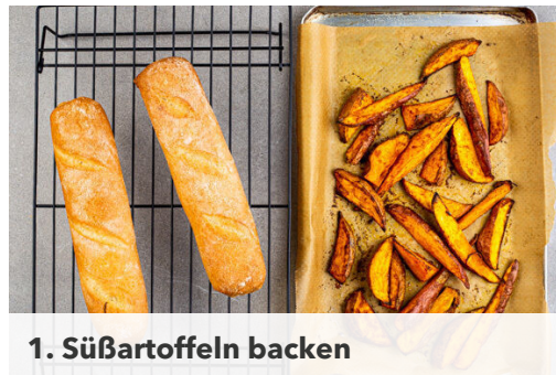
1. Süßkartoffeln backen

Energie 962kcal, Fett 43.7g, Kohlenhydrate 106.5g, Eiweiß 31.6g