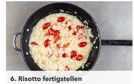
6. Risotto fertigstellen

Die Lauchzwiebeln in feine Ringe schneiden. In einer großen Schüssel 2EL Olivenöl, 2EL Essig, 2TL Honig und je 1 kräftigen Prise Salz und Pfeffer zu einem Dressing verrühren und den Salatmix und die Lauchzwiebeln untermengen.