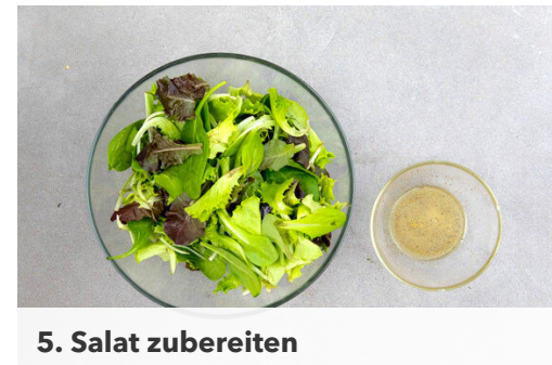
5. Salat zubereiten

In der Zwischenzeit den Käse fein reiben. Den Schinken in feine Streifen schneiden.