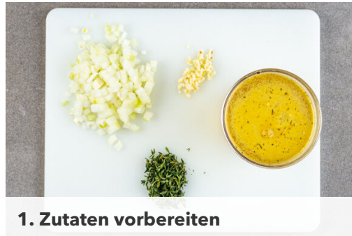
1. Zutaten vorbereiten

Energie 759kcal, Fett 32.2g, Kohlenhydrate 91.7g, Eiweiß 25.4g