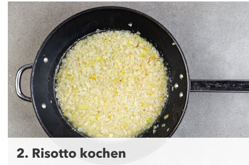
2. Risotto kochen

Den Backofen auf 200°C (180°C Umluft) vorheizen. Die Zwiebel schälen, halbieren und in feine Würfel schneiden. Den Knoblauch schälen und ebenfalls fein würfeln. Die Thymianblättchen von den Stängeln streifen. Das Brühwürz in 1,7L heißem Wasser auflösen.