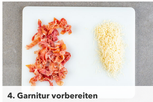
4. Garnitur vorbereiten

Die Tomaten halbieren und mit dem Knoblauch , der 1/2 des Thymians und 2EL Olivenöl in einer Auflaufform vermengen. Mit je 1 kräftigen Prise Salz, Pfeffer und Zucker würzen und die Tomaten 10-12Min. im Ofen backen.