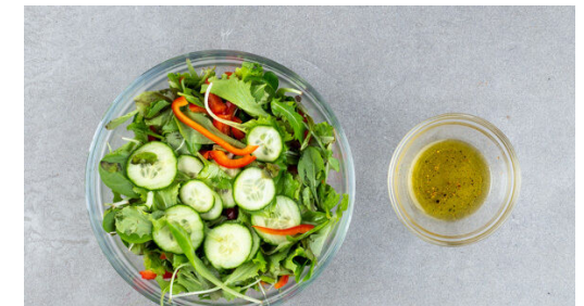
6. Salat zubereiten

Die Gurke in dünne Scheiben schneiden. Die Zwiebel schälen und in feine Ringe schneiden. Die Paprika vierteln, entkernen und in dünne Streifen schneiden. Den Knoblauch schälen und fein würfeln. Die Peperoni längs halbieren und ca. \frac{1}{3} oder mehr in feine Würfel schneiden. Tipp: Für weniger Schärfe die Kerne entfernen.