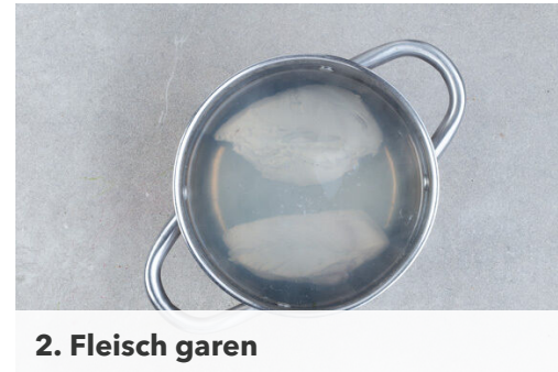
2. Fleisch garen

Die Zwiebeln , den Knoblauch und die Peperoni in einer mittelgroßen Pfanne mit 1EL Olivenöl bei mittlerer Hitze 2-3Min. anbraten. Die Hitze reduzieren und das Ketjap Manis , 2EL Ketchup und 1 kräftige Prise Zucker unterrühren. Bei Bedarf etwas Wasser hinzufügen. Tipp: Wenn Kinder mitessen, die Peperoni weglassen und später nur das eigene Sandwich garnieren.