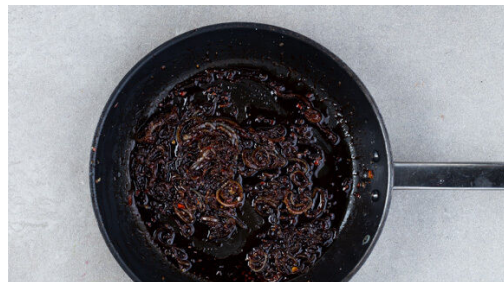
4. Sauce zubereiten

Den Backofen auf 220°C (200°C Umluft) vorheizen. Die Kartoffeln samt Schale in Spalten schneiden. Auf einem mit Backpapier ausgelegten Backblech mit 1EL Olivenöl, 1 kräftigen Prise Salz und ggf. 1 Prise Pfeffer vermengen und ca. 20Min. im Ofen goldbraun backen. Die Brötchen ggf. auf einem zweiten Blech 4-6Min. aufbacken, dann abkühlen lassen.