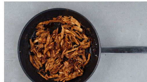
5. Fleisch hinzugeben

Das Fleisch trocken tupfen und längs halbieren. In einem mittelgroßen Topf mit kaltem, leicht gesalzenem Wasser bedecken. Das Wasser zum Kochen bringen und das Fleisch abgedeckt bei mittlerer Hitze 8-10Min. kochen, bis es gar ist. In ein Sieb abgießen und abtropfen lassen.