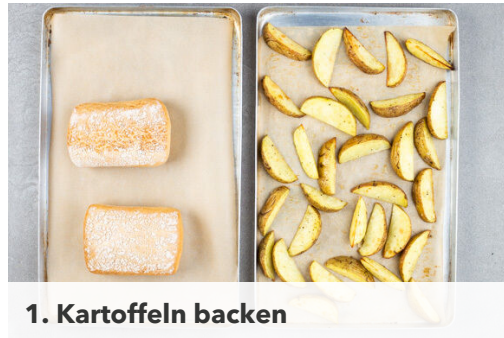
1. Kartoffeln backen

Energie 809kcal, Fett 28.1g, Kohlenhydrate 94.5g, Eiweiß 41.4g