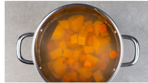
2. Gemüse kochen

In einem mittelgroßen Topf ausreichend gesalzenes Wasser für das Gemüse zum Kochen bringen. Die Süßkartoffeln schälen und in ca. 2cm große Würfel schneiden. Die Karotten ggf. schälen und in ca. 2cm dicke Scheiben schneiden.