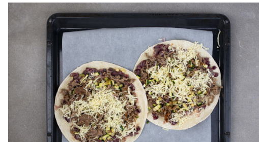
5. Tortillas füllen

Das Hackfleisch in einer großen Pfanne mit 2EL Olivenöl bei starker Hitze 3-4Min. anbraten. Die Zucchini , die restlichen Zwiebeln und den restlichen Knoblauch hinzugeben und 3-4Min. mitbraten. Mit Salz und Pfeffer abschmecken und mit der Gewürzmischung nach Geschmack verfeinern.