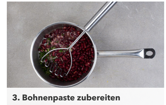
3. Bohnenpaste zubereiten

Den Koriander samt Stängeln fein schneiden. Die Tomaten in kleine Würfel schneiden, dabei den Strunk entfernen, dann mit 1EL Zwiebeln , 2EL Olivenöl und 1-2TL Koriander verrühren. Die Salsa mit Salz und Pfeffer abschmecken.