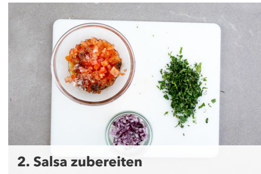
2. Salsa zubereiten

Den Backofen auf 200°C (180°C Umluft) vorheizen. Die Zucchini in ca. 0,5cm kleine Würfel schneiden. Die Zwiebel schälen, halbieren und fein würfeln. Den Knoblauch schälen und ebenfalls fein würfeln oder reiben.