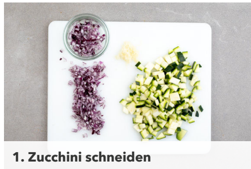
1. Zucchini schneiden

Energie 1011kcal, Fett 48.6g, Kohlenhydrate 86.7g, Eiweiß 55.4g