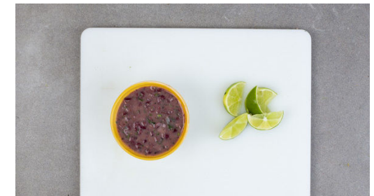
6. Dip anrühren

4 Tortillas auf zwei mit Backpapier ausgelegte Backbleche legen, dünn mit der Bohnenpaste bestreichen – es sollte Paste übrig bleiben –, die Hackmasse darauf verteilen und mit dem Käse bestreuen. Mit jeweils 1 Tortilla bedecken, diese leicht andrücken und die Quesadillas im Ofen 6-7Min. backen, bis sie goldbraun sind und der Käse geschmolzen ist.