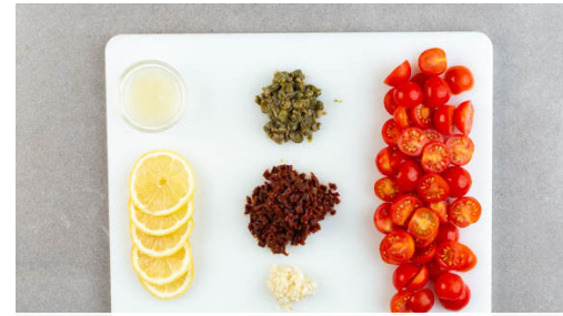
2. Zutaten vorbereiten

Das Fleisch trocken tupfen und von beiden Seiten mit je 1 Prise Salz und Pfeffer würzen, dann in 2EL Mehl wenden. In einer großen Pfanne mit 2EL Olivenöl bei mittlerer bis starker Hitze auf jeder Seite 1-2Min. anbraten, aus der Pfanne nehmen und beiseitestellen.