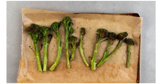
3. Brokkolini rösten

Die Zitronenscheiben , die Kapern und den Knoblauch in derselben Pfanne in dem Bratensaft bei mittlerer Hitze ca. 1Min. anbraten. 2TL Mehl unterrühren, 300ml Wasser mit dem Brühwürz zufügen, aufkochen und 2-3Min. köcheln. Das Fleisch hinzugeben und in 3-4Min. gar kochen. Die Sauce mit 2EL Butter verfeinern und mit Zitronensaft , Salz und Pfeffer abschmecken.