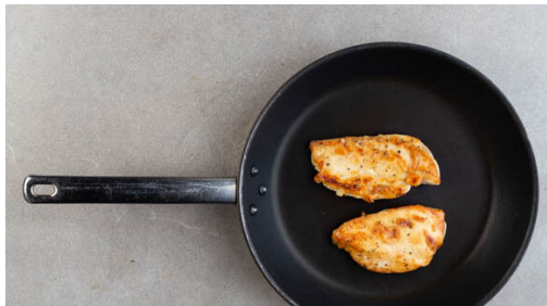
4. Fleisch anbraten

Den Backofen auf 240°C (220°C Umluft) vorheizen. Die Kartoffeln schälen und je nach Größe halbieren oder vierteln, dann in einem großen Topf mit ausreichend gesalzenem Wasser zum Kochen bringen und in 15-20Min. gar kochen. Die Kartoffeln abgießen und zurück in den Topf geben.