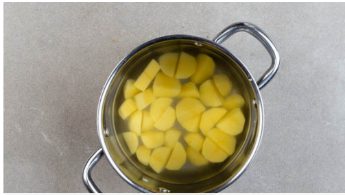
1. Kartoffeln kochen

Energie 994kcal, Fett 56.1g, Kohlenhydrate 57.4g, Eiweiß 61.7g