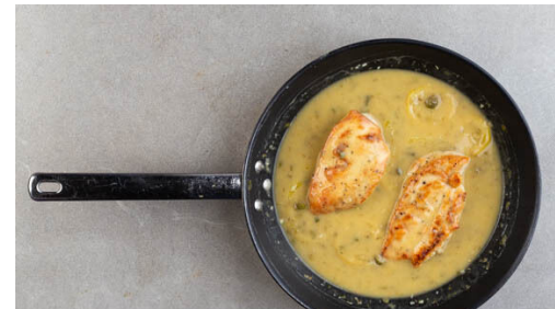
5. Sauce und Fleisch garen

1 Zitrone halbieren und auspressen, die übrige Zitrone in dünne Scheiben schneiden. Die Kapern grob schneiden. Den Knoblauch schälen und fein würfeln. Die getrockneten Tomaten fein schneiden. Die Kirschtomaten halbieren.