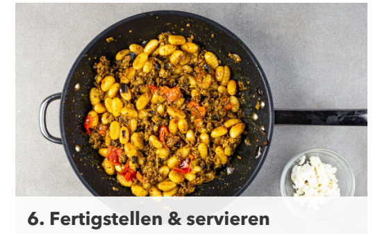
6. Fertigstellen & servieren

Die Tomaten , die Tajine-Gewürzmischung sowie 3EL Wasser in die Pfanne geben und bei mittlerer Hitze 14-16Min. köcheln lassen, bis das Gemüse gar ist. Bei Bedarf etwas mehr Wasser zugeben.