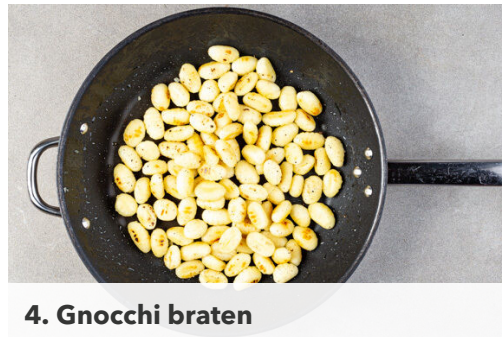
4. Gnocchi braten

Die Aubergine in ca. 1cm große Würfel schneiden. Die Tomate in 2-3cm große Stücke schneiden und den Knoblauch schälen. Die Zitrone halbieren und eine Hälfte in Spalten schneiden, die andere Hälfte auspressen.