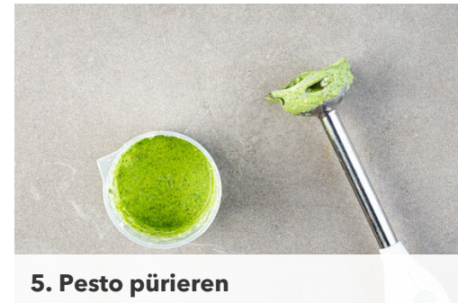
5. Pesto pürieren

Das Hackfleisch und die Auberginen in einer großen Pfanne mit 1EL Olivenöl sowie je 1 kräftigen Prise Salz und Pfeffer bei starker Hitze 3-4Min. anbraten, dabei gelegentlich umrühren.