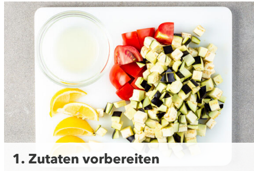
1. Zutaten vorbereiten

Energie 1032kcal, Fett 53.5g, Kohlenhydrate 94.0g, Eiweiß 46.8g