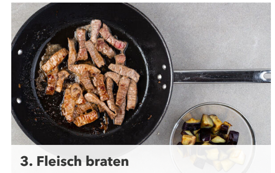
3. Fleisch braten

800ml heißes Wasser in die Pfanne geben und die Sauce 6–8Min. bis zur gewünschten Konsistenz einköcheln lassen. Inzwischen den Brokkoli auf ein mit Backpapier ausgelegtes Backblech geben, mit 2EL Pflanzenöl sowie je 1 kräftigen Prise Salz und Pfeffer vermengen und 6–8Min. im Ofen rösten, bis der Brokkoli an den Rändern zu bräunen beginnt.