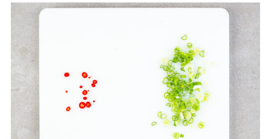
6. Garnitur vorbereiten

Die Auberginen in einer großen Pfanne mit 2EL Pflanzenöl bei starker Hitze 4–5Min. goldbraun anbraten, dann aus der Pfanne nehmen. Das Fleisch trocken tupfen und in derselben Pfanne mit 1EL Pflanzenöl bei starker Hitze 3–4Min. anbraten. Auf einem Teller beiseitestellen.