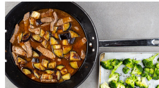
5. Sauce fertigstellen

Den Ingwer und den Knoblauch schälen und fein würfeln. Die Maisstärke mit 3–4EL kaltem Wasser verrühren, dann die Sojasauce , die 1/2 der Chilipaste oder mehr nach Geschmack sowie 1TL Zucker oder Honig unterrühren. Tipp: Die Chilipaste ist sehr scharf, also lieber erst weniger verwenden und am Ende nachwürzen.