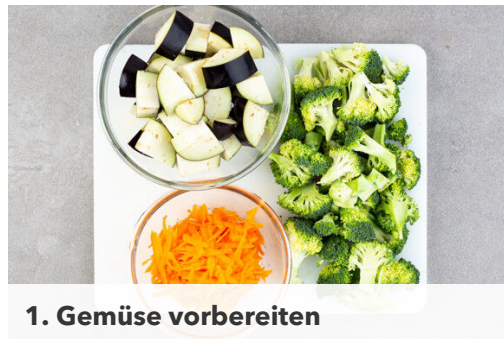
1. Gemüse vorbereiten

Energie 541kcal, Fett 30.5g, Kohlenhydrate 32.1g, Eiweiß 31.3g