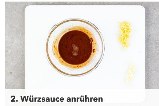
2. Würzsauce anrühren

Den Ingwer und den Knoblauch in derselben Pfanne mit 1EL Pflanzenöl bei mittlerer Hitze ca. 1Min. anbraten. Mit der Würzsauce ablöschen und diese 1–2Min. sirupartig eindicken lassen. Die Auberginen und das Fleisch zurück in die Pfanne geben und gut mit der Sauce verrühren.