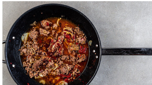
4. Hackfleisch verfeinern

Den Backofen auf 240°C (220°C Umluft) vorheizen. Die Zwiebeln schälen, halbieren und in ca. 0,5cm dünne Streifen schneiden. Die Zwiebeln in einer großen Pfanne mit 2EL Pflanzenöl und 1 kräftigen Prise Salz bei mittlerer bis starker Hitze 1-2Min. anschwitzen. Dann bei mittlerer bis niedriger Hitze weitere 6-8Min. braten, bis die Zwiebeln weich sind.