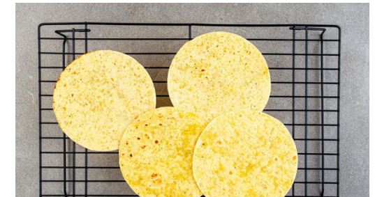
6. Tortillas erwärmen

Das Brühgewürz und die Chiliflocken mit 250ml heißem Wasser verrühren und beiseitestellen. Das Tomatenmark und das Hackfleisch zu den Zwiebeln in die Pfanne geben und bei starker Hitze 3-4Min. mitbraten, bis das Hackfleisch leicht gebräunt ist.