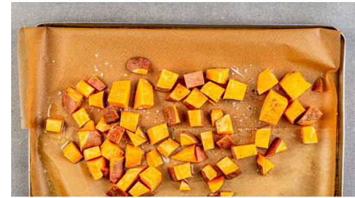
2. Süßkartoffeln rösten

Die Chili-Brühe und 2EL Schokodrops in die Pfanne geben. Abgedeckt bei sehr niedriger Hitze ca. 10Min. köcheln lassen, dabei gelegentlich umrühren. Tipp: Die übrigen Schokodrops beim Kochen vernaschen oder beim Frühstück unter den Joghurt rühren.