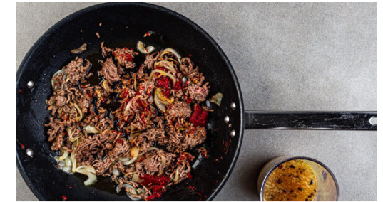
3. Hackfleisch braten

Inzwischen die Limettenschalen abreiben, dann die Limetten halbieren und auspressen. Den Limettensaft mit 2TL Zucker und ½TL Salz zu einem Einlegesud verrühren. Die Radieschen vom Grün befreien und vierteln, dann mit dem Einlegesud und der Limettenschale vermengen.