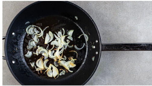
1. Zwiebeln braten

Energie 935kcal, Fett 42.8g, Kohlenhydrate 103.1g, Eiweiß 33.6g