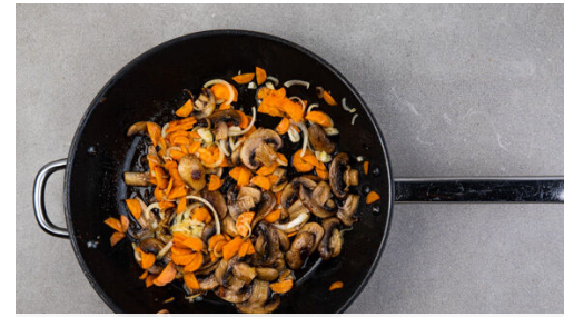
2. Gemüse braten

1EL Mehl unter das Gemüse rühren und ca. 1Min. mitgaren. Mit 100ml Kochwasser ablöschen und gut verrühren. Noch einmal 50-100ml Kochwasser angießen und unterrühren, bis eine cremige Sauce entsteht. Ggf. noch etwas einkochen lassen, bis die Sauce an einem Löffel haften bleibt. Vom Herd nehmen und die Sauce mit Salz und Pfeffer abschmecken.