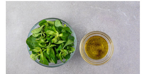
6. Salat zubereiten

Den Teig mit dem Papier nach unten auf einem Backblech ausrollen. Mit einer Messerspitze rundum einen ca. 1cm breiten Rand einzeichnen und die innenliegende Fläche gleichmäßig einstechen. Den Teig auf der unteren Schiene ca. 12Min. vorbacken.