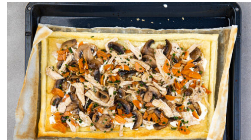
5. Flammkuchen backen

Die Karotte ggf. schälen, längs halbieren und quer in dünne Scheiben schneiden. Die Zwiebel schälen, halbieren und grob würfeln. Beides in einer großen Pfanne mit 2-3EL Olivenöl oder Butter bei mittlerer Hitze 4-5Min. braten, bis das Gemüse weich wird. Die Pilze ggf. säubern, in dünne Scheiben schneiden und unter häufigem Rühren 7-8Min. mitbraten, bis sie appetitlich bräunen.