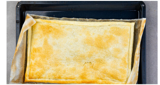
3. Teig vorbacken

Den Schnittlauch in kleine Röllchen schneiden und die Hälfte mit dem Fleisch unter das Gemüse rühren. Den Teig mit der Crème fraîche bestreichen, dann gleichmäßig das Ragout darauf verteilen. Den Flammkuchen weitere 5-7Min. backen. Nach der Hälfte der Zeit das Blech um 180° drehen.