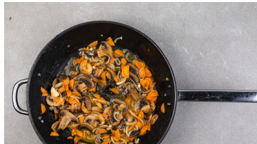
4. Sauce zubereiten

Den Backofen auf 240°C (220°C Umluft) vorheizen. In einem Wasserkocher reichlich Wasser aufkochen. Das Fleisch mit 1 Prise Salz in einen mittelgroßen Topf geben und mit dem kochenden Wasser übergießen, dann bei mittlerer Hitze ca. 10Min. sanft köcheln lassen. Das Fleisch herausnehmen, kurz abkühlen lassen und mit zwei Gabeln zerzupfen. Das Kochwasser aufbewahren.