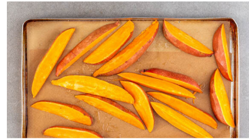
2. Süßkartoffeln backen

Die Orangen halbieren und auspressen. 1TL Oregano und 1TL Kreuzkümmel-Koriander-Gewürzmischung vermengen. Den Knoblauch schälen, sehr fein würfeln oder durch eine Knoblauchpresse drücken und unterrühren.