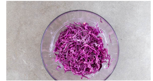
3. Rotkohl zubereiten

Das Fleisch trocken tupfen und in einer großen Pfanne mit 2EL Olivenöl bei starker Hitze auf jeder Seite 2-3Min. braten, abhängig davon, ob es medium oder eher durchgebraten sein soll. Das Fleisch aus der Pfanne nehmen und abgedeckt auf einem Teller ruhen lassen. Die Pfanne wird weiterverwendet. Den Mais in dicke Scheiben schneiden.