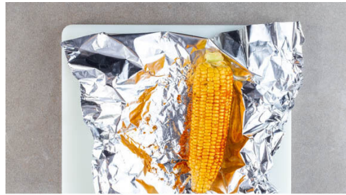
1. Mais verfeinern

Energie 789kcal, Fett 45.4g, Kohlenhydrate 59.4g, Eiweiß 36.6g