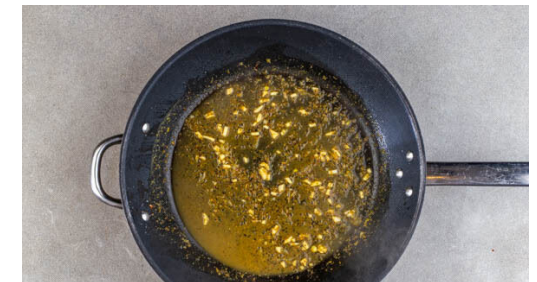
6. Orangensauce zubereiten

4EL Mayonnaise, 2EL hellen Essig, 2EL Wasser, 1 kräftige Prise Zucker und je ½TL Salz und Pfeffer verrühren und mit dem Rotkohl verkneten, bis er weich wird. Dabei am besten Küchenhandschuhe tragen.