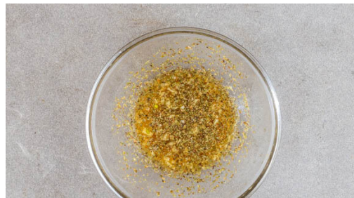
4. Würzung vorbereiten

Den Backofen auf 220°C (200°C Umluft) vorheizen. Die Maiskolben ggf. von den Hüllblättern und Fäden befreien und auf einem Stück Alufolie mit 1EL Olivenöl, der Cajun-Gewürzmischung und 2 Prisen Salz einreiben. Das Maispäckchen verschließen und in den vorheizenden Ofen geben.