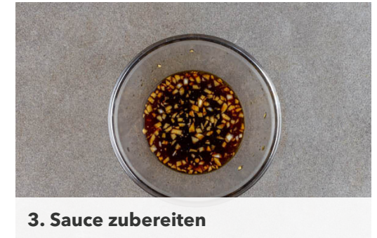
3. Sauce zubereiten

Die Zwiebeln und die Paprika in einer großen Pfanne mit 4EL Pflanzenöl bei mittlerer Hitze 5-7Min. braten, bis die Paprika weich und die Zwiebeln glasig sind.