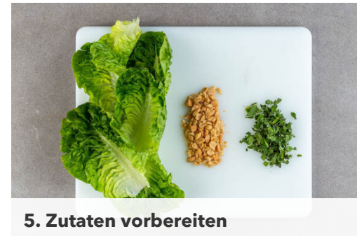
5. Zutaten vorbereiten

Das Hackfleisch mit 1 kräftigen Prise Salz zum Gemüse in die Pfanne geben, mit einem Kochlöffel zerteilen und in 6-10Min. knusprig braten. Die Gewürzmischung und das restliche Ketjap Manis einrühren. Alles gut verrühren, ggf. 2-3TL Wasser zufügen.