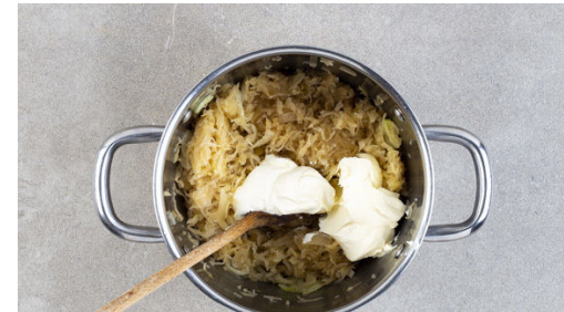
2. Sauerkraut zubereiten

Die Zwiebeln schälen und in dünne Ringe schneiden.