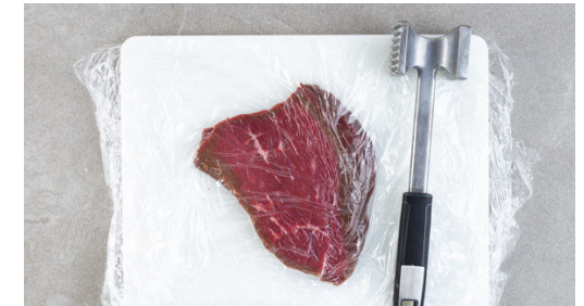
3. Fleisch vorbereiten

Ca. 1/4 der Zwiebeln in einem mittelgroßen Topf mit 1-2EL Pflanzenöl bei mittlerer Hitze 2-3Min. glasig anbraten. Das Sauerkraut , die Crème fraîche und ca. 1/4 des Brühgewürzes dazugeben und alles gut verrühren. Das Sauerkraut einmal aufkochen lassen und mit Salz und Pfeffer abschmecken. Bis zum Servieren warm halten.