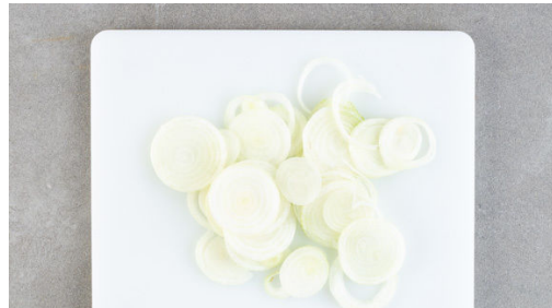
1. Zwiebeln schneiden

Energie 927kcal, Fett 49.0g, Kohlenhydrate 68.4g, Eiweiß 44.6g