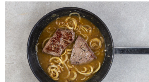
5. Zwiebelsauce zubereiten

Das Fleisch in einer großen Pfanne mit 1-2EL Pflanzenöl bei starker Hitze auf jeder Seite 1-2Min. scharf anbraten. Aus der Pfanne nehmen und beiseitestellen.