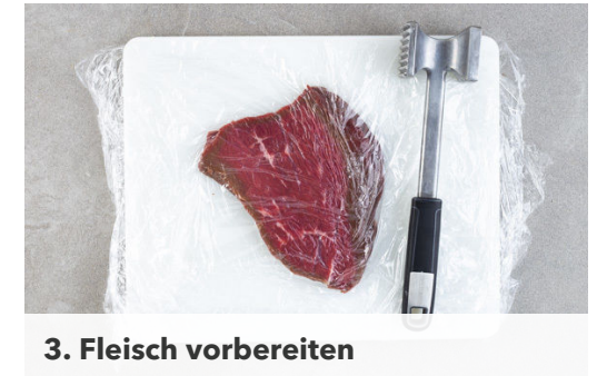
3. Fleisch vorbereiten

Ca. 1/4 der Zwiebeln in einem mittelgroßen Topf mit 2-3EL Pflanzenöl bei mittlerer Hitze 2-3Min. glasig anbraten. Das Sauerkraut , die Crème fraîche und ca. 1/4 des Brühgewürzes dazugeben und alles gut verrühren. Das Sauerkraut einmal aufkochen lassen und mit Salz und Pfeffer abschmecken. Bis zum Servieren warm halten.