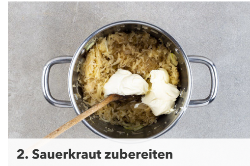
2. Sauerkraut zubereiten

Die Zwiebeln schälen und in dünne Ringe schneiden.