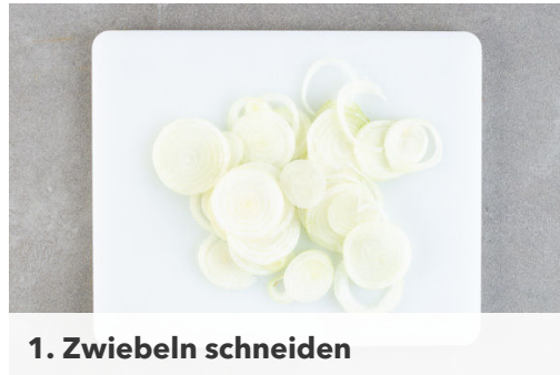
1. Zwiebeln schneiden

Energie 894kcal, Fett 49.6g, Kohlenhydrate 64.1g, Eiweiß 42.9g