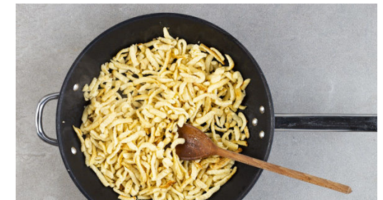
6. Spätzle braten

Die restlichen Zwiebeln in der Pfanne mit 1-2EL Öl bei mittlerer Hitze 5-6Min. goldbraun anbraten. Mit 1EL Mehl bestäuben und mit 400-450ml Wasser ablöschen, dann das restliche Brühgewürz unterrühren und die Sauce 3-4Min. bei mittlerer Hitze einköcheln lassen. Mit Pfeffer und 1-2TL Worcestershiresauce abschmecken. Das Fleisch bis zum Servieren in der Sauce ziehen lassen.