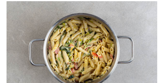
6. Pasta fertigstellen

Die Tomaten in ca. 1 cm große Würfel schneiden. Den Knoblauch schälen und ebenfalls fein würfeln. Von 1 Zitrone die Schale abreiben, dann beide Zitronen halbieren und auspressen.