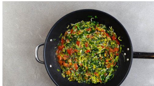
4. Sauce kochen

In einem großen Topf ausreichend gesalzenes Wasser für die Pasta zum Kochen bringen. Die Pasta in das kochende Wasser geben und in 8-10Min. bissfest kochen. Mit einem Messbecher 200ml Pastawasser abschöpfen, dann die Pasta in ein Sieb abgießen und abtropfen lassen. Zurück in den Topf geben und abgedeckt warm halten.