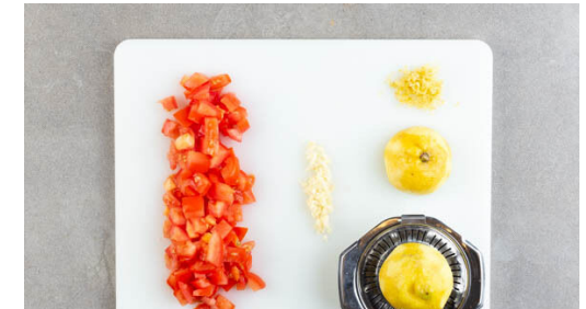
3. Zutaten vorbereiten

Das Fleisch trocken tupfen und rundum mit je 1 Prise Salz und Pfeffer würzen. In einer zweiten großen Pfanne mit 2EL Pflanzenöl bei mittlerer bis starker Hitze auf jeder Seite 3-4Min. goldbraun und gar braten. In der letzten Minute der Garzeit 1½EL Butter hinzufügen und schmelzen lassen, dann die Pfanne vom Herd nehmen und die ½ des Zitronensafts angießen.