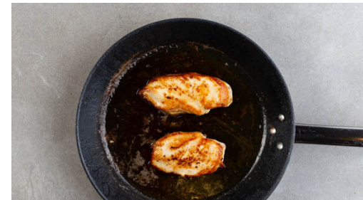
5. Fleisch braten

Inzwischen den Lauch jeweils längs halbieren und quer in dünne Scheiben schneiden, dann in einer großen Pfanne mit 1EL Pflanzenöl und je 1 kräftigen Prise Salz, Pfeffer und Zucker bei mittlerer bis starker Hitze in 4-5Min. weich braten.