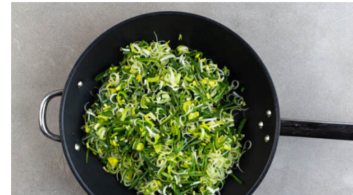
2. Lauch braten

Die Tomaten und den Knoblauch mit 1 kräftigen Prise Salz in die Pfanne geben und bei mittlerer bis starker Hitze 2-3Min. mitbraten, bis die Tomaten anfangen aufzuplatzen. Die ½ der Gewürzmischung und 100ml Pastawasser einrühren und 6-8Min. köcheln lassen, bis die Tomaten zerfallen sind, dabei öfters umrühren.