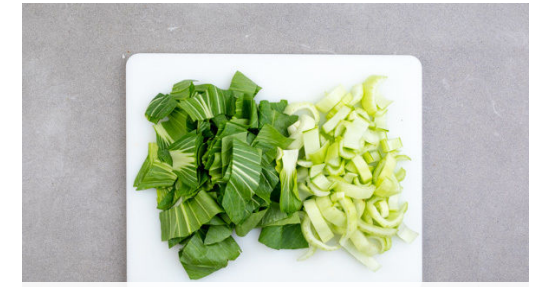
3. Gemüse schneiden

Die weißen Pak-Choi-Streifen in einer zweiten Pfanne mit 2EL Pflanzenöl bei starker Hitze 1-2Min. unter Rühren anbraten. Die grünen Pak-Choi-Streifen und die restliche Sojasauce dazugeben und ca. 2Min. mitbraten.