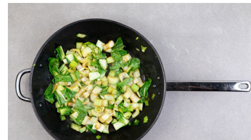
5. Pak Choi braten

Den Reis in einem Sieb kalt abspülen, bis das Wasser klar bleibt. Sobald das Kokoswasser kocht, den Reis hineingeben und abgedeckt bei niedrigster Hitze 10-12Min. kochen, bis das Kokoswasser aufgesogen und der Reis gar ist. Noch ca. 5Min. ohne Hitzezufuhr ziehen lassen.