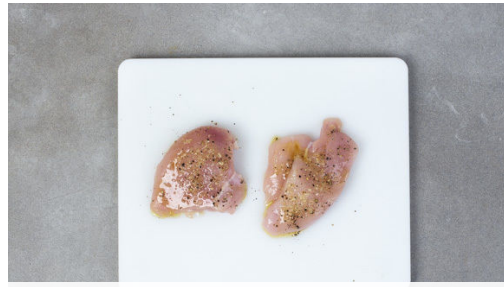
1. Fleisch würzen

Energie 1009kcal, Fett 43.1g, Kohlenhydrate 89.0g, Eiweiß 63.0g