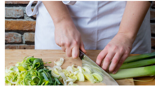
2. Lauch schneiden

Den Backofen auf 220°C (200°C Umluft) vorheizen. Das Fleisch trocken tupfen, in mundgerechte Stücke schneiden und mit 1EL Olivenöl und der Gewürzmischung vermengen.