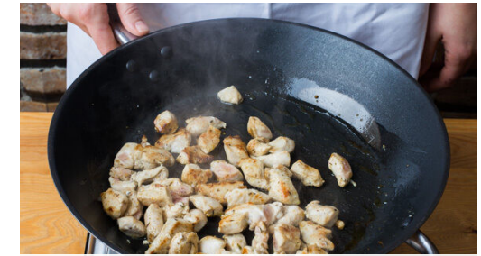
3. Fleisch braten

Den Lauch längs halbieren und in dünne Scheiben schneiden.