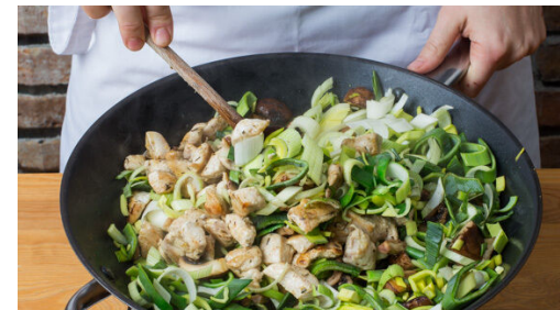
5. Gemüse braten

Die Pilze ggf. säubern und je nach Größe vierteln oder achteln.