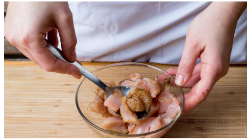
1. Fleisch würzen

Energie 1049kcal, Fett 69.8g, Kohlenhydrate 57.3g, Eiweiß 42.3g