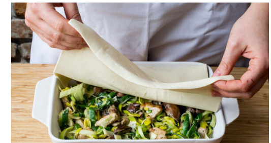
6. Pie vorbereiten

Die Pilze in der Pfanne mit 1EL Olivenöl bei starker Hitze 2-3Min. anbraten. Den Lauch und das Fleisch untermengen. Die Crème fraîche und die ½ des Brühwürzes oder nach Geschmack mehr einrühren und alles 3-4Min. sanft köcheln lassen. Mit Salz und Pfeffer abschmecken.