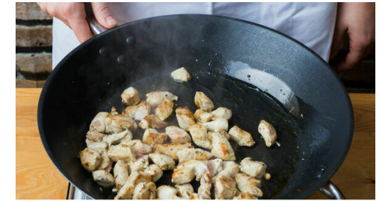
3. Fleisch braten

Den Lauch längs halbieren und in dünne Scheiben schneiden.