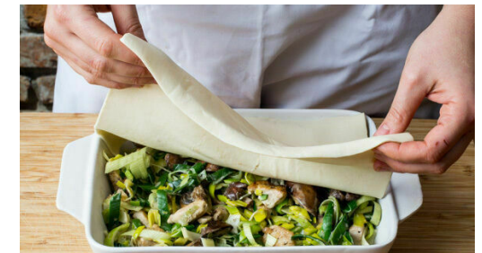
6. Pie vorbereiten

Die Pilze in der Pfanne mit 2EL Olivenöl bei starker Hitze 2-3Min. anbraten. Den Lauch und das Fleisch untermengen. Die Crème fraîche und das Brühgewürz einrühren und alles 3-4Min. sanft köcheln lassen. Mit Salz und Pfeffer abschmecken.