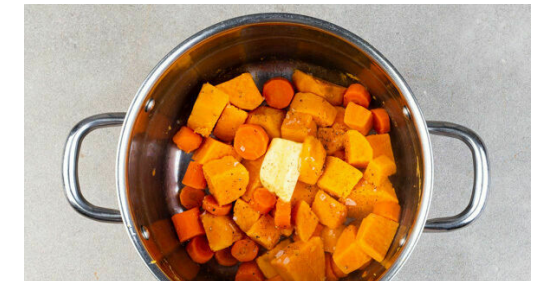
6. Gemüse stampfen

Die Tomaten und die Lauchzwiebeln mit 2TL Essig vermengen. Mit Salz, Pfeffer und Zucker abschmecken.