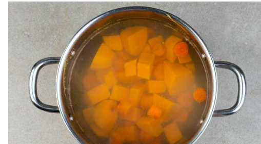
2. Gemüse kochen

In einem großen Topf ausreichend gesalzenes Wasser für das Gemüse zum Kochen bringen. Die Süßkartoffeln schälen und in ca. 2cm große Würfel schneiden. Die Karotten ggf. schälen und in ca. 2cm dicke Scheiben schneiden.