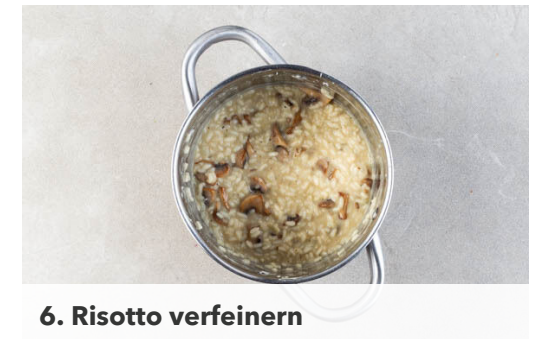
6. Risotto verfeinern

Das Hackfleisch in derselben Pfanne mit 2EL Olivenöl bei mittlerer bis starker Hitze 4-5Min. kross anbraten. Mit der Gewürzmischung sowie Salz und Pfeffer abschmecken.