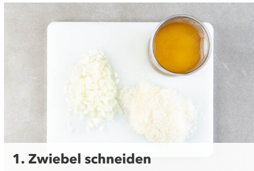
1. Zwiebel schneiden

Energie 1065kcal, Fett 48.9g, Kohlenhydrate 112.7g, Eiweiß 44.7g