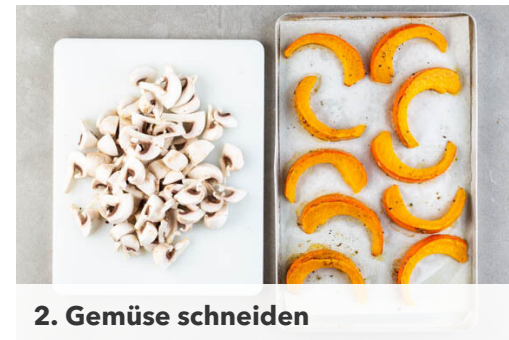
2. Gemüse schneiden

Den Backofen auf 250°C (230°C Umluft) vorheizen. Die Zwiebel schälen, halbieren und in feine Würfel schneiden. Den Käse fein reiben. Das Brühgewürz in 1,7L heißem Wasser auflösen.