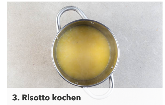
3. Risotto kochen

Die Pilze ggf. säubern und je nach Größe halbieren oder vierteln. Die Kürbisse vierteln, entkernen und in 1-2cm dünne Spalten schneiden. Die Kürbisspalten auf einem mit Backpapier ausgelegten Backblech mit 2EL Olivenöl beträufeln, mit je 1 kräftigen Prise Salz und Pfeffer würzen und 15-20Min. im Ofen goldbraun backen.