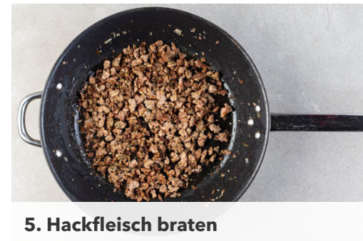
5. Hackfleisch braten

Nebenher die Pilze in einer großen Pfanne mit 2EL Olivenöl bei starker Hitze 4-5Min. scharf anbraten, aus der Pfanne nehmen und beiseitestellen.