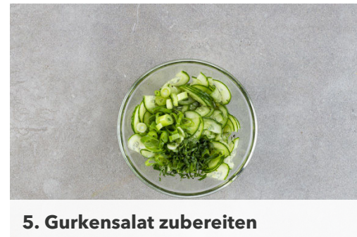
5. Gurkensalat zubereiten

Die Hähnchenteile in eine Auflaufform legen und im Ofen 30-40Min. backen, bis das Fleisch in der Mitte gar ist. Dabei die Hähnchenteile alle 10Min. wenden, damit sie von allen Seiten knusprig braun werden. Ca. 5Min. vor Ende der Garzeit 50ml Wasser angießen.