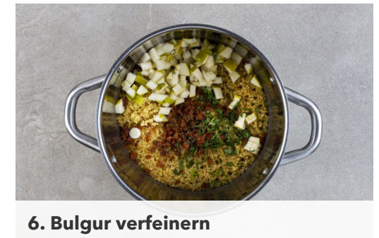
6. Bulgur verfeinern

Ca. ¼ der Gewürzmischung und das Brühgewürz in das kochende Wasser geben, dann den Bulgur untermischen und abgedeckt bei niedriger Hitze 8-10Min. sanft köcheln lassen, bis das Wasser aufgesaugt und der Bulgur gar ist. Noch ca. 5Min. ohne Hitzezufuhr ziehen lassen.