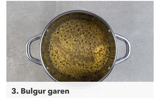
3. Bulgur garen

Die Gurke längs halbieren und quer in dünne Scheiben schneiden. 3EL Olivenöl, 2EL Essig und je 1 kräftige Prise Salz, Pfeffer und Zucker zu einem Dressing verrühren und die Gurken untermengen. Den Gurkensalat ca. 5Min. ziehen lassen, dann die ½ der Lauchzwiebeln und ca. ¼ der Petersilie untermischen. Nach Geschmack mit Salz und Pfeffer nachwürzen.