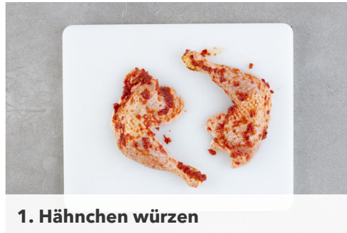
1. Hähnchen würzen

Energie 867kcal, Fett 43.3g, Kohlenhydrate 66.6g, Eiweiß 47.1g