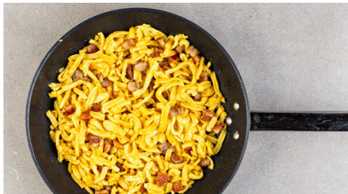
4. Spätzle mitbraten

Die Zwiebel schälen und fein würfeln. Die Pilze ggf. säubern und je nach Größe halbieren oder vierteln. Den Sellerie quer in ca. 0,5cm breite Scheiben schneiden. Die Zwiebeln , den Sellerie und die Pilze mit 1 kräftigen Prise Salz und 2EL Olivenöl in der zweiten Pfanne bei sehr starker Hitze 6-8Min. braten, bis das Gemüse gar und appetitlich gebräunt ist.