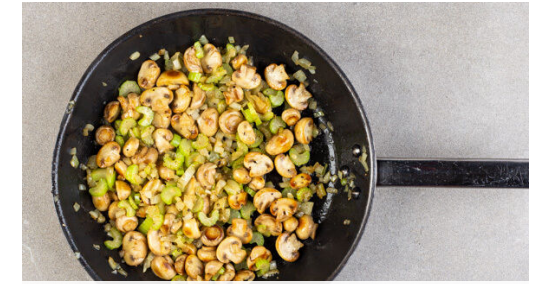
3. Gemüse braten

Die Sonnenblumenkerne in einer zweiten großen Pfanne ohne Zugabe von Fett bei mittlerer Hitze 1-2Min. goldbraun anrösten. Vorsicht , sie können schnell zu dunkel werden. Zum Abkühlen aus der Pfanne nehmen und beiseitestellen.