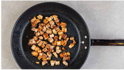
1. Schweinebauch braten

Energie 1058kcal, Fett 70.5g, Kohlenhydrate 65.2g, Eiweiß 41.0g