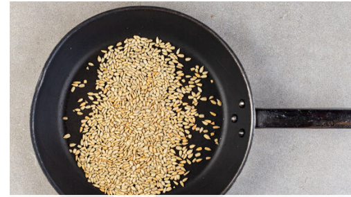
2. Sonnenblumenkerne rösten

Den Schweinebauch in ca. 1cm große Würfel schneiden und mit ½TL Salz in einer großen Pfanne bei mittlerer bis niedriger Hitze 10-12Min. braten, bis der größte Teil des Fetts ausgetreten ist.