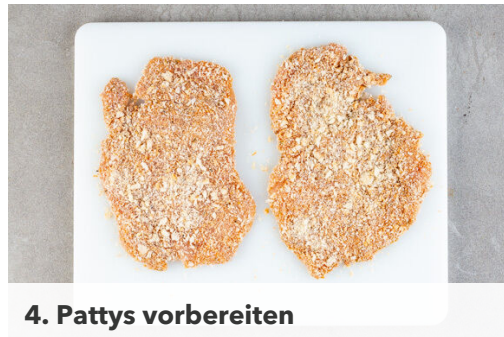
4. Pattys vorbereiten

Den Backofen auf 240°C (220°C Umluft) vorheizen. Die Kartoffeln samt Schale in einem mittelgroßen Topf mit leicht gesalzenem Wasser bedecken und zum Kochen bringen, dann ca. 12Min. kochen lassen.