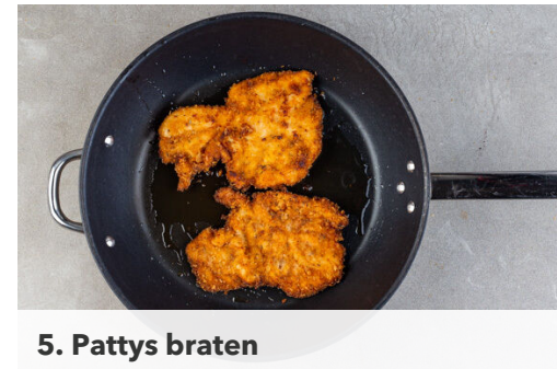
5. Pattys braten

Den Salat in mundgerechte Stücke schneiden. Die Tomaten in dünne Scheiben schneiden. Aus 2EL Olivenöl, 1EL Essig und je 1 Prise Salz, Pfeffer und Zucker ein Dressing anrühren.