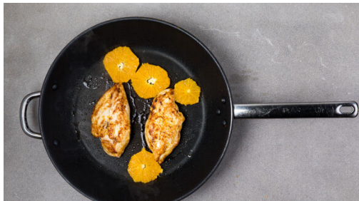
4. Fleisch braten

Den Backofen auf 220°C (200°C Umluft) vorheizen. Die Orangenschale abreiben, mit einem scharfen Messer die weiße Haut um das Fruchtfleisch entfernen. Das Fruchtfleisch in ca. 0,5cm dünne Scheiben schneiden, den Saft auffangen. Die Gurke in kleine Würfel schneiden. Die Karotten ggf. schälen und mit dem Sparschäler rundum in Streifen schneiden.