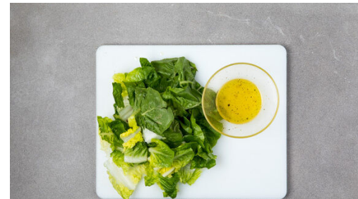
5. Dressing anrühren

Das Fleisch trocken tupfen und längs halbieren. 2EL Olivenöl, 1-2TL Orangenschale , 1 kräftige Prise Salz und 2TL der Gewürzmischung oder mehr nach Geschmack zu einer Marinade verrühren. Das Fleisch mit der Marinade einreiben und beiseitestellen.