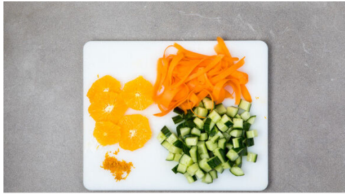
1. Gemüse vorbereiten

Energie 641kcal, Fett 24.8g, Kohlenhydrate 62.6g, Eiweiß 37.0g