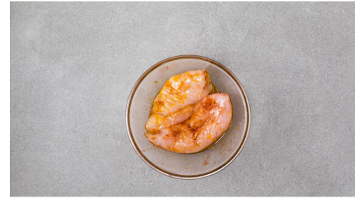
2. Fleisch marinieren

Das Fleisch in einer großen Pfanne bei starker Hitze auf jeder Seite 3-4Min. scharf anbraten, bis es in der Mitte durch ist. Die Orangenscheiben für die letzte Minute dazugeben und kurz karamellisieren lassen, dann beiseitestellen.