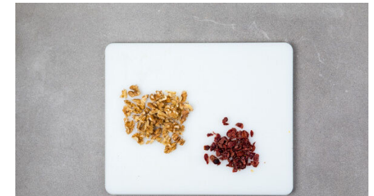
6. Garnitur vorbereiten

Den Knoblauch schälen und sehr fein würfeln oder durch eine Knoblauchpresse drücken. Die Petersilie samt Stängeln fein hacken. 2-3EL Olivenöl und je 1 Prise Salz und Pfeffer mit dem Knoblauch und der Petersilie verrühren. Das Brötchen halbieren und die Hälften quer teilen. Mit dem Kräuteröl bestreichen und auf einem mit Backpapier ausgelegten Blech im Ofen 7-9Min. backen.