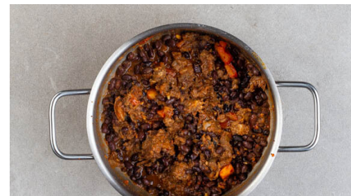
5. Gulasch köcheln

Die ½ des Rotkohls in sehr feine Streifen schneiden, dabei den harten Strunk entfernen. Den übrigen Rotkohl für ein anderes Rezept aufbewahren. Die Rotkohlstreifen mit 2EL Essig und 1 kräftigen Prise Salz vermengen und mit den Händen ca. 1Min. kneten, bis der Rotkohl etwas weicher wird.