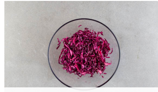
2. Rotkohl vorbereiten

Den Knoblauch und die Gewürzmischung in einem mittelgroßen Topf mit 1EL Olivenöl bei mittlerer Hitze ca. 30Sek. anschwitzen, dann die Tomaten dazugeben und 3-4Min. mitbraten, bis sie etwas weicher werden.