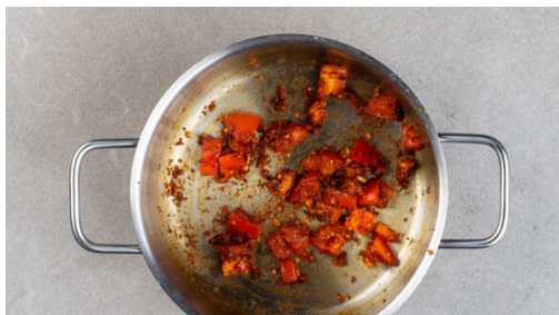
4. Knoblauch & Tomate braten

Den Backofen auf 240°C (220°C Umluft) vorheizen. Die Süßkartoffeln halbieren, mehrmals mit einer Gabel einstechen und mit den Schnittseiten nach unten auf einem mit Backpapier ausgelegten Backblech verteilen. Die Süßkartoffeln 25-30Min. im Ofen backen.