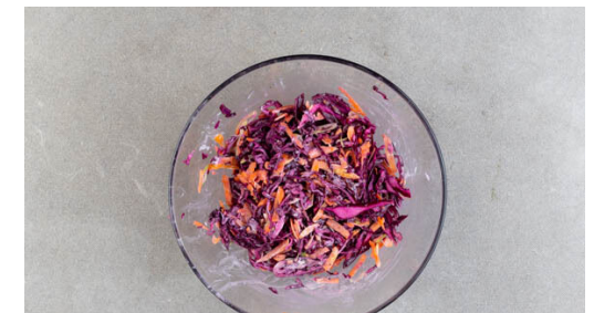
6. Salat zubereiten

Die Tomate in grobe Würfel schneiden. Den Knoblauch schälen und ebenfalls grob würfeln.