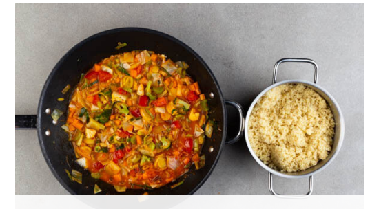
6. Gemüse verfeinern

Die Mandelblättchen in einer weiteren mittelgroßen Pfanne ohne Zugabe von Fett bei mittlerer Hitze 1-2Min. goldbraun anrösten. Vorsicht , sie können schnell zu dunkel werden. Zum Abkühlen herausnehmen und beiseitestellen, die Pfanne aufbewahren.