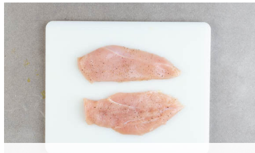
4. Fleisch vorbereiten

In einem kleinen Topf 300ml Wasser zum Kochen bringen. Den Topf vom Herd nehmen, den Couscous und die ½ des Brühgewürzes in das kochende Wasser rühren und abgedeckt 6-8Min. quellen lassen. Die Tomate in ca. 1cm große Würfel schneiden.