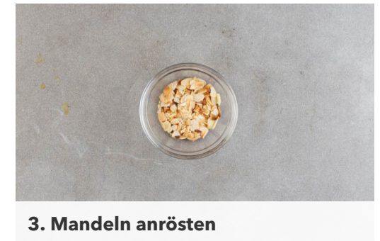
3. Mandeln anrösten

Das Fleisch in der Pfanne mit 1EL Olivenöl bei mittlerer Hitze auf jeder Seite 2-3Min. braten, dabei rundum mit der Gewürzmischung bestreuen.