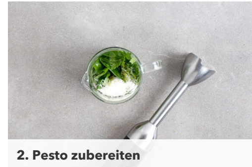
2. Pesto zubereiten

Die Rouladen in einer großen Pfanne mit 1EL Olivenöl bei starker Hitze ca. 2Min. rundum scharf anbraten. Die Rouladen anschließend aus der Pfanne nehmen, in eine Auflaufform geben und im Ofen ca. 8Min. garen, bis das Fleisch gar ist. Die Pfanne aufbewahren.