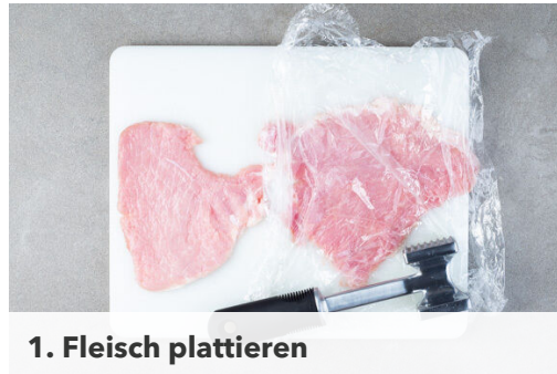
1. Fleisch plattieren

Energie 614kcal, Fett 40.1g, Kohlenhydrate 29.3g, Eiweiß 36.3g