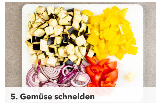
5. Gemüse schneiden

Den Käse fein reiben. Das Basilikum und die Petersilie samt Stängeln grob schneiden und mit dem Käse sowie 2EL Olivenöl in einem hohen Gefäß mit einem Stabmixer zu einem glatten Pesto pürieren. Ggf. noch 1-2EL Olivenöl oder etwas Wasser hinzugeben. Das Pesto mit Salz abschmecken.