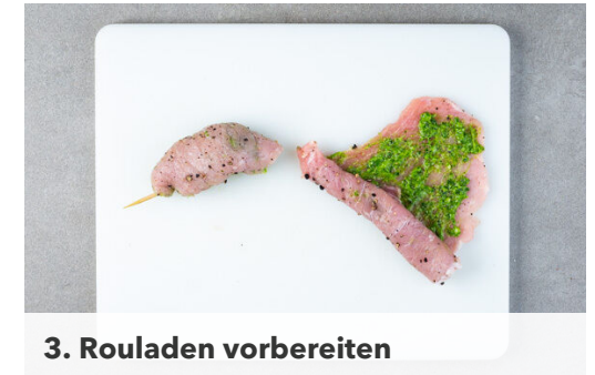
3. Rouladen vorbereiten

Die Aubergine in 1-2cm große Würfel schneiden. Die Paprika vierteln, entkernen und ebenfalls in 1-2cm große Würfel schneiden. Die Tomate grob würfeln. Die Zwiebel schälen, halbieren und in feine Streifen schneiden. Den Knoblauch schälen und fein würfeln.