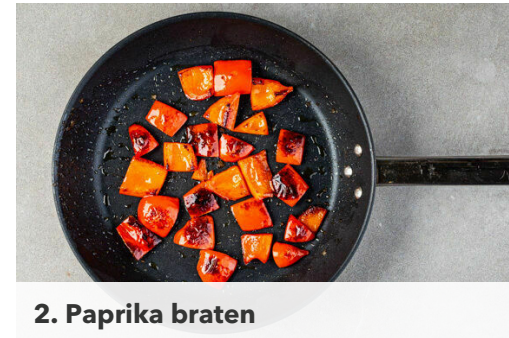
2. Paprika braten

Das Fleisch trocken tupfen und in der zweiten großen Pfanne mit 2EL Olivenöl und 1 kräftigen Prise Salz bei mittlerer bis starker Hitze ca. 3Min. rundum goldbraun anbraten. Die Zucchini dazugeben und bei mittlerer Hitze weitere 6-8Min. braten. Die Pfanne vom Herd nehmen, sobald die Zucchini weich und das Fleisch gar ist.