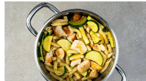
5. Pasta kochen

Die Paprika in einer großen Pfanne mit 1EL Olivenöl und 1 Prise Salz bei mittlerer bis starker Hitze 8-9Min. weich braten, dabei gelegentlich umrühren. Die Sonnenblumenkerne in einer zweiten großen Pfanne ohne Zugabe von Fett bei mittlerer Hitze 1-2Min. goldbraun anrösten. Vorsicht , sie können schnell zu dunkel werden. Zum Abkühlen aus der Pfanne nehmen und beiseitestellen.