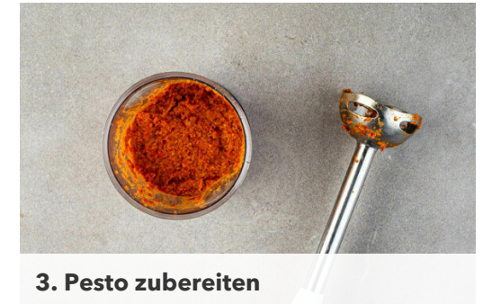
3. Pesto zubereiten

Die Pasta in das kochende Wasser geben und in 8-10Min. bissfest kochen. 150ml Kochwasser abschöpfen, dann die Pasta in ein Sieb abgießen und abtropfen lassen. Die Pasta und 150ml Kochwasser zurück in den Topf geben, das fertig gebratene Fleisch und die Zucchini hinzufügen.