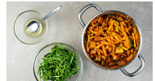
6. Fertigstellen & servieren

Den Käse fein reiben. Die Sonnenblumenkerne , den Käse , die getrockneten Tomaten , die Paprika , den Knoblauch , 1EL Essig und 2 kräftige Prisen Salz in einem hohen Gefäß mit einem Stabmixer zu einem glatten Pesto pürieren.