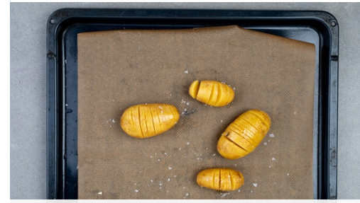
2. Kartoffeln backen

Den Backofen auf 240°C (220°C Umluft) vorheizen. Das Fleisch 20-30Min. vor der Zubereitung aus dem Kühlschrank nehmen und Raumtemperatur annehmen lassen. Die Zwiebel und den Knoblauch schälen, halbieren und in feine Würfel schneiden. Die ½ des Brühgewürzes in 250ml heißem Wasser auflösen.