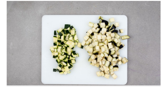
3. Gemüse schneiden

Die Kartoffeln samt Schale mit einem scharfen Messer in Abständen von 2-3mm ein-, aber nicht durchschneiden: Sie sollen nicht auseinanderfallen, sondern fächerartig aufklappen. Die Kartoffeln auf ein mit Backpapier ausgelegtes Backblech geben, mit 1 Prise Salz und 1EL Olivenöl einreiben und 35-45Min. backen, bis sie goldbraun und gar sind.