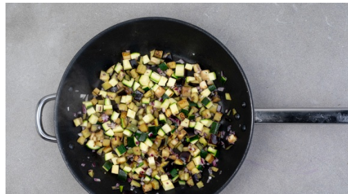
4. Gemüse braten

Die Zucchini und die Aubergine in ca. 1cm kleine Würfel schneiden. Die Auberginenwürfel leicht salzen.