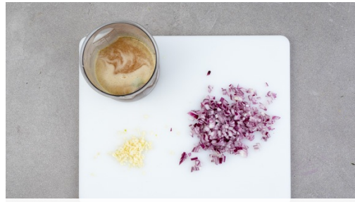
1. Zutaten vorbereiten

Energie 588kcal, Fett 18.9g, Kohlenhydrate 63.9g, Eiweiß 39.4g