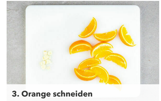
3. Orange schneiden

Die Orangen nach weiteren 5Min. ebenfalls auf den Backblechen verteilen und ggf. die Position der Bleche tauschen. Nach weiteren 15Min. den Knoblauch dazugeben und den Rest der Garzeit mitbacken, bis das Fleisch knusprig ist.