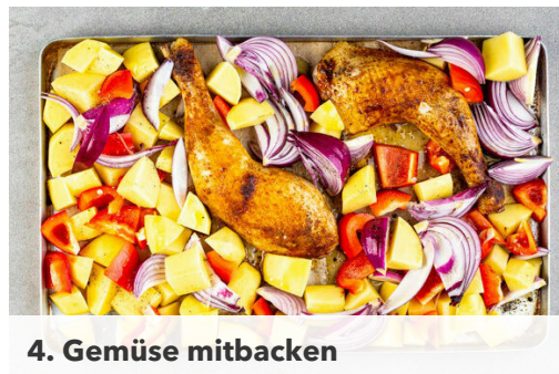
4. Gemüse mitbacken

Den Backofen auf 220°C (200°C Umluft) vorheizen. Das Fleisch trocken tupfen und rundum mit dem Paprikapulver , 1TL Salz und 1 Prise Pfeffer einreiben. Auf zwei mit Backpapier ausgelegten Backblechen ca. 35Min. im Ofen backen, dabei 2-3-mal wenden, die letzten Minuten aber mit der Hautseite nach oben legen.