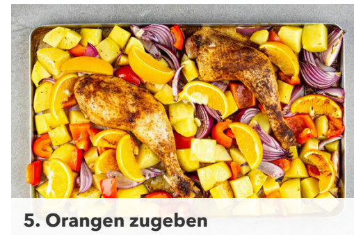
5. Orangen zugeben

Die Kartoffeln ggf. schälen und in ca. 3cm große Stücke schneiden. Die Paprika vierteln, entkernen und in ca. 2cm große Stücke schneiden. Die Zwiebeln schälen, halbieren und in breite Spalten schneiden.