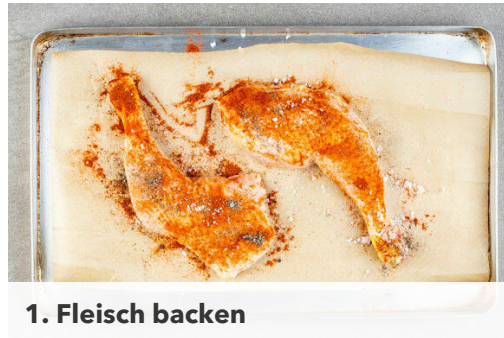
1. Fleisch backen

Energie 768kcal, Fett 40.8g, Kohlenhydrate 57.1g, Eiweiß 41.5g