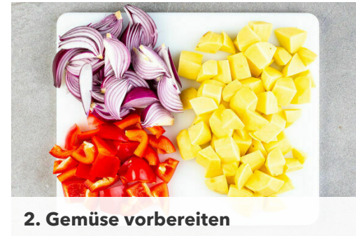
2. Gemüse vorbereiten

Die Kartoffeln , die Paprika und die Zwiebeln mit 4EL Olivenöl sowie je 2 Prisen Salz und Pfeffer vermengen und nach 10Min. Backzeit zum Fleisch auf die Backbleche geben und mitbacken.