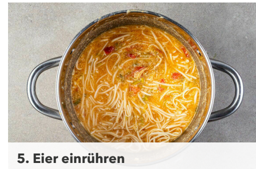
5. Eier einrühren

Das Fleisch trocken tupfen und jeweils horizontal in 2 dünnere Filets schneiden.