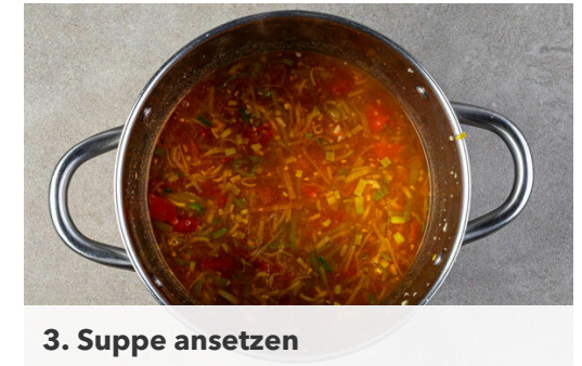
3. Suppe ansetzen

Die Eier in einer Schale mit je 1 Prise Salz und Pfeffer verquirlen, dann langsam in die Suppe einrühren, sodass sich Fäden bilden. Die Suppe erneut für ca. 1Min. erhitzen, bis die Eier gar sind. Die Nudeln dazugeben und 30Sek.-1Min. erwärmen. Den Topf vom Herd nehmen und das Sesamöl einrühren. Die Suppe mit Salz, Zucker und Essig abschmecken.