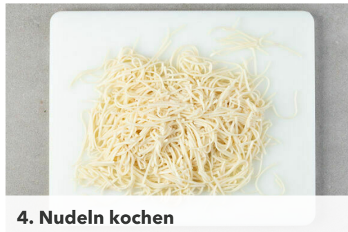
4. Nudeln kochen

In einem großen Topf ausreichend gesalzenes Wasser für die Nudeln zum Kochen bringen. Den Lauch längs halbieren und in feine Streifen schneiden. Etwa 4EL dunkelgrüne Lauchstreifen für die Garnitur beiseitelegen. Den Knoblauch schälen und fein würfeln oder reiben. Den Ingwer fein reiben. Die Tomaten grob würfeln.