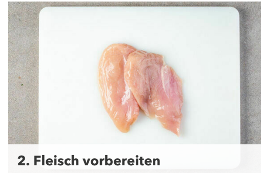
2. Fleisch vorbereiten

Die Nudeln in das kochende Wasser geben und in ca. 4Min. bissfest kochen. In ein Sieb abgießen und kalt abschrecken. Die Nudeln mit einer Schere in 4-5cm lange Stücke schneiden.