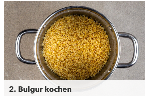
2. Bulgur kochen

Die Limettenschalen abreiben, dann die Limetten halbieren und auspressen. Die Kräuter samt Stängeln fein schneiden. Die Tomaten in dünne Spalten schneiden und mit der 1/2 der Kräuter , der 1/2 des Limettensafts und 2EL Olivenöl vermengen. Die Salsa mit Salz abschmecken.