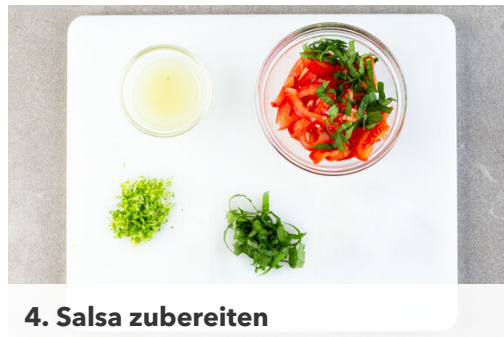
4. Salsa zubereiten

In einem mittelgroßen Topf ausreichend gesalzenes Wasser für den Brokkoli zum Kochen bringen. In einem zweiten mittelgroßen Topf 600ml leicht gesalzenes Wasser für den Bulgur aufkochen. Den Brokkoli in mundgerechte Röschen schneiden. Die Lauchzwiebeln in feine Ringe schneiden. Den Knoblauch schälen und fein reiben oder durch eine Knoblauchpresse drücken.