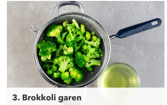
3. Brokkoli garen

Die Sriracha-Sauce mit dem Knoblauch , dem restlichen Limettensaft und 4EL Mayonnaise verrühren. Mit der Limettenschale und Salz abschmecken. Die Mandeln grob hacken und in einer großen Pfanne ohne Zugabe von Fett bei mittlerer Hitze 1-2Min. goldbraun anrösten. Vorsicht , sie können schnell zu dunkel werden. Auf einem Teller beiseitestellen.