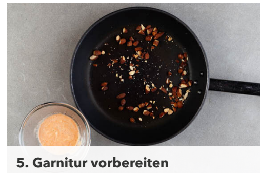
5. Garnitur vorbereiten

Den Bulgur in das kochende Wasser rühren und abgedeckt bei niedriger Hitze 8-10Min. sanft köcheln lassen, bis das Wasser aufgesaugt und der Bulgur gar ist. Noch ca. 5Min. ohne Hitzezufuhr ziehen lassen.