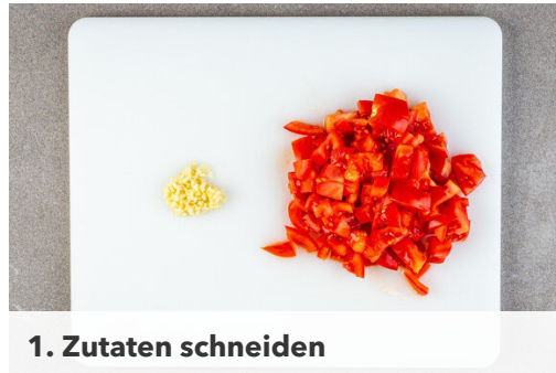
1. Zutaten schneiden

Energie 973kcal, Fett 52.3g, Kohlenhydrate 79.7g, Eiweiß 45.9g