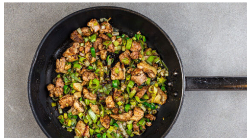
4. Fleisch mitbraten

Den Backofen auf 220°C (200°C Umluft) vorheizen. Den Knoblauch schälen und sehr fein würfeln oder durch eine Knoblauchpresse drücken. Die Tomaten in 0,5-1cm große Würfel schneiden.