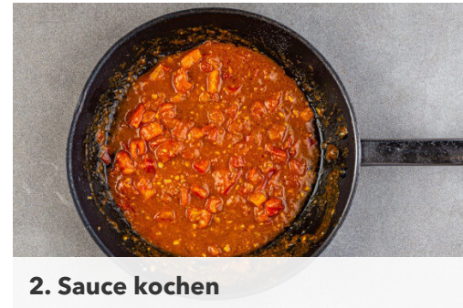
2. Sauce kochen

Das Fleisch trocken tupfen und in ca. 1cm große Stücke schneiden. Das Fleisch mit der Gewürzmischung in die Pfanne zu dem Lauch geben, 2-3Min. mitbraten und mit je 1 Prise Salz und Pfeffer würzen.